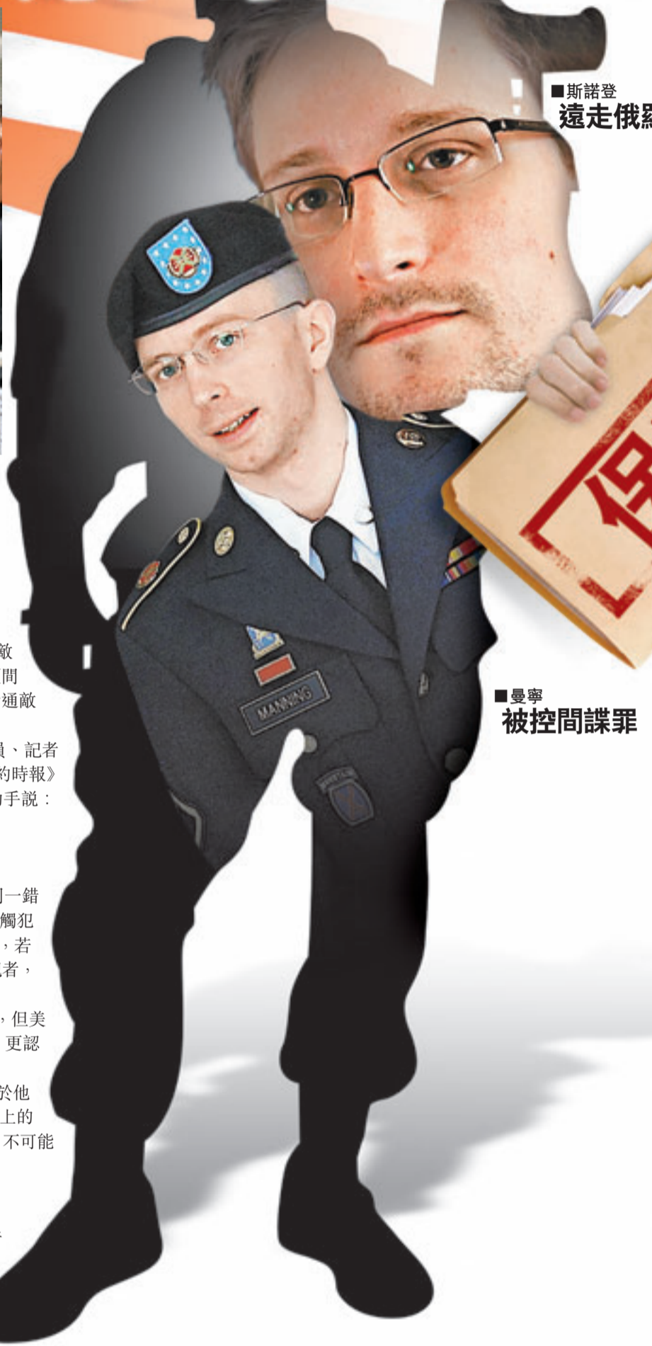
斯諾登 遠走俄羅斯