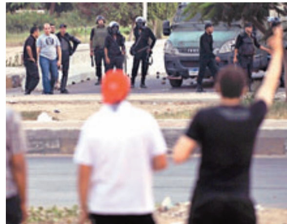
示威者與警方對峙。