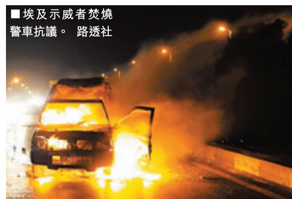
埃及示威者焚燒 警車抗議。