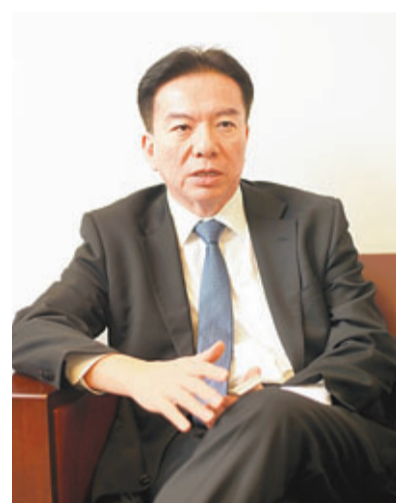
黃友嘉指，小組將陸續聯絡擁有正等候重建或收樓的單位業權人士，以搜羅更多空置單位。