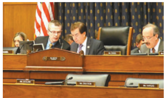
美聯邦眾議院外交委員會1日通過《2013台灣政策法案》。

內地「環球網」報道，台灣問題本屬於中國大陸的內政，但美國出於自身利益需要，常常介入台灣問題，干涉中國內政。評論指，在美國政府看來，隔三差五地向台灣出售武器，已然成爲一種慣例，事實上，「以台制華」是美國遏制中國和平發展的主要手段。美方行徑嚴重違反中美三個聯合公報特別是「八一七」公報原則，嚴重干涉中國內政，嚴重危害中國國家安全，損害中國和平統一大業和中美關係。