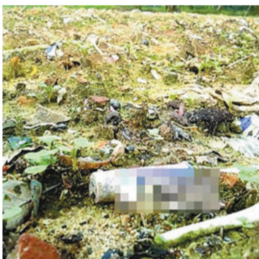
■廢電池、碎玻璃瓶等金屬垃圾堆滿菜田。網上圖片

香港文匯報訊 廣州番禺金山村早前被媒體曝光「用垃圾肥種菜」引發社會軒然大波,但據廣州媒體報道,目前當地菜地裡仍隨處可見廢電池、碎玻璃瓶、打火機、水筆、貝殼等金屬垃圾,且較以前更多。但村民則否認「垃圾肥」,並稱是用氮肥。廣州市農業局稱,已督促番禺農業部門防止不合格蔬菜流入市場。