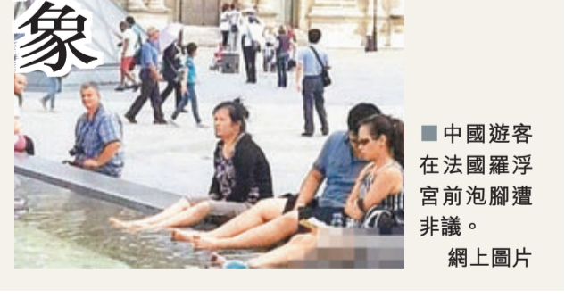
■中國遊客在法國羅浮宮內泡腳遭非議。

到底是什麼原因導致不文明行為的發生?中國人民大學社會學系教授周孝正指出,部分出境遊客雖然經濟富裕,但文化素質偏低,對不文明行為缺乏內在道德約束。同時,一些旅遊經營者在服務質量、行前教育方面存在較大欠缺,對遊客不文明行為疏於引導和管束。《人民日報》昨日刊發題為「每個人都是文明使者」文章,談及中國人在羅浮宮水池泡腳事件。文章稱,一些人文明素質的提升並不像腰包鼓得那麼快,中國遊客在海外的形象常被戲稱為「金主」,貢獻了消費卻得不到尊重。這種鮮明反差,不僅與中國「禮儀之邦」的形象不符,也在很大程度上損害着中國的海外形象。