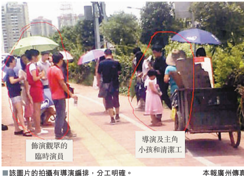
■該圖片的拍攝有導演編排,分工明確。