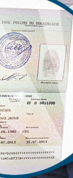
律師展示斯諾登臨時入境證件的副本。