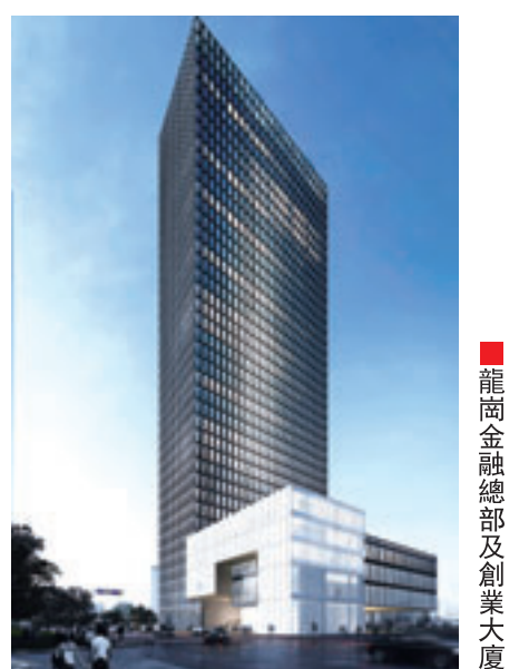
龍崗金融總部及創業大廈

90萬平方米低成本的金業業用房主要位於龍城工業園內的金融總部及創業大樓，該項目建設用地1萬平方米，建築面積13萬平方米，目前已開工建設，預計3年左右推出。其他金融業用房還有龍崗天安數碼城、正中時代廣場和萬科大廈等。