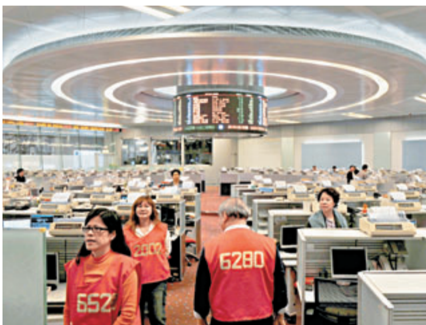
■有業界認為只要重磅股業績符合預期, 以實際數字回應市場對經濟前景的質疑, 港股便有突破空間。

藍籌方面, 嚴重超買的騰訊(0700)回吐3.3%, 收報351.8元。和黃(0013)今日