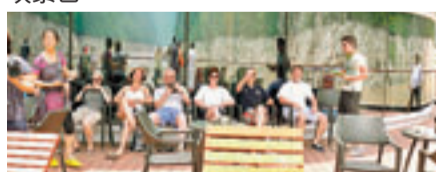
■船上有不少外國遊客在度假