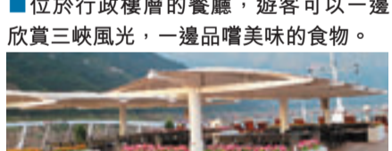
■船上頂樓的甲板，可坐在此欣賞三峽景色。