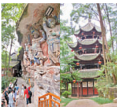
■石刻全在懸崖上，遊人仰望。

晚唐時四川西部的柳本尊自創密宗，苦行傳道，弘揚大法，高僧趙智鳳承其教，號稱「六代祖師傳密印」，在昌州大足傳教布道，70餘年間鑿建了寶頂山摩崖造像。這座石窟史上罕見而有特色的密宗道場的石刻包括大佛灣、小佛灣等13處造像群，共有摩崖造像近萬尊，題材主要以佛教密宗故事人物為主，到南北宋、明、清仍有新鑿的石刻續修，最終形成了一處規模龐大的石刻群，堪稱中國晚期石窟藝術的代表，與雲崗石窟、龍門石窟和莫高窟相齊名。