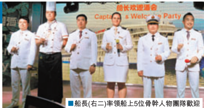
■船長(右二)率領船上5位骨幹人物團隊歡迎