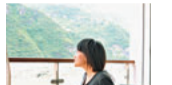
在豪華客房裡，你可在露台欣賞三峽風光。