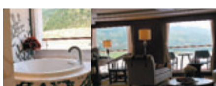
■船上總統套房，你可以一邊欣賞三峽景色，一邊洗浴，非常寫意。

遊長江三峽離不開坐船，只是坐船的級數不同，時代進步，記得十多年前小記坐過的是比天星小輪稍大規模的遊船，今次坐的是五星級郵輪世紀神話號，感覺上最強烈的不同是，當年有探險的心情，如今有數世界的味道。目前在長江江面上，每天都有各式各樣等級不同的郵輪載着遊客來回暢遊，世紀神話號及世紀傳奇號遊輪隸屬重慶世紀遊輪艦隊，兩艘走高格調的郵船，以英美、德國、台灣、港澳東南亞客人較多，由香港出發約5千元團費。如果在重慶上船的內地客四日三夜都是兩千多元，內地不少高收入階層也負擔得起。