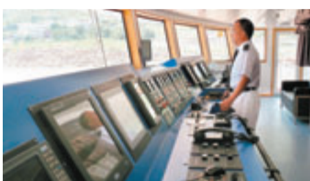
■在駕駛室，駕駛員正專心工作。