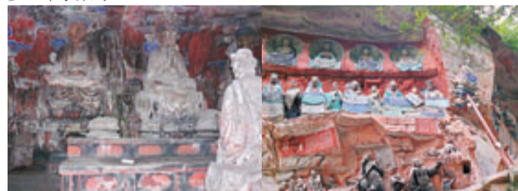
■重慶大足寶頂山石刻

「六道輪迴圖像」被雕刻在石崖上，圖中無常大鬼長舒兩臂抱六趣輪，輪中刻六道眾生輪迴相。為佛教「六趣唯心」、「因果業報」、「十二因緣」教義的形象體現。無論是雕刻的精益求精還是顏色的鮮艷都讓人眼前一亮，作為非佛教徒，看完後對六道輪迴的含義會清晰了許多，印象深刻。