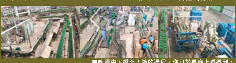
■啤酒由入樽至入箱的過程，你可於長廊上看到。