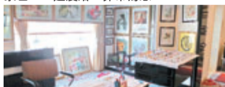
■你可在船上買一些小手信