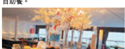
■位於行政樓層的餐廳，遊客可以一邊欣賞三峽風光，一邊品嚐美味的食物。