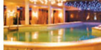
■遊客可在船上游泳

豪華郵輪每個房間都設露台，方便欣賞三峽景色。船上娛樂設施不少，有觀光電梯、小商店、有戲院、閱讀室、健身室、Salon和Spa、泳池、卡拉OK房、康樂房，遊客可攻打四方城，並設有兩個餐廳。酒吧有菲律賓人樂隊表演；船上的三晚，第一天有船長歡迎晚會，第三晚有派對，先食豐富晚宴再看由船員表演的跳舞、唱歌、魔術、連川劇絕活「變臉」都有。在航行期間，可安排三峽知識講座、中國武術太極教學、書法和雕刻，很超值，外國人特別喜歡。