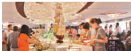
■這間餐廳以船形設計，遊客在此品嚐自助餐。