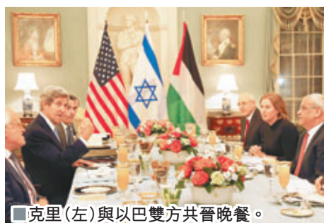
克里(左)與以巴雙方共晉晚餐。