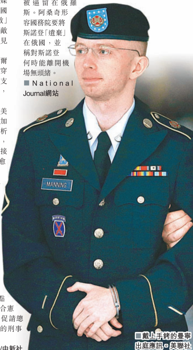
戴上手銬的曼寧出庭應訊。