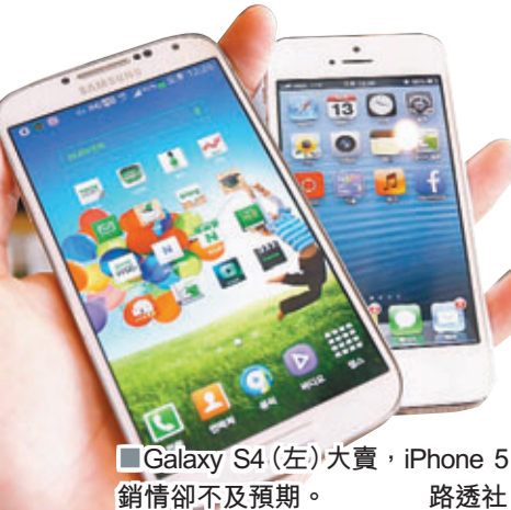
Galaxy S4(左)大賣, iPhone 5銷情卻不及預期。