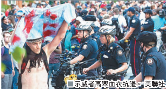
示威者高舉血衣抗議。