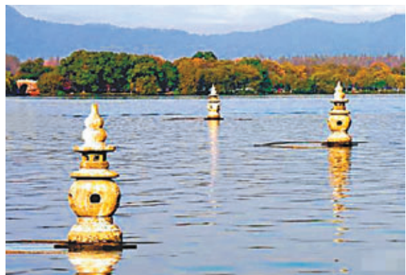
「三潭印月」景點事發前的畫面。

香港文匯報(實習記者 高施倩 杭州報道) 29日晚，杭州西湖十景之一「三潭印月」被遊船撞掉一潭。30日，記者在西湖景區看到，「三潭印月」景觀已恢復，但被撞石塔塔身仍有輕微的傾斜，且三座石塔附近拉起了警戒線。