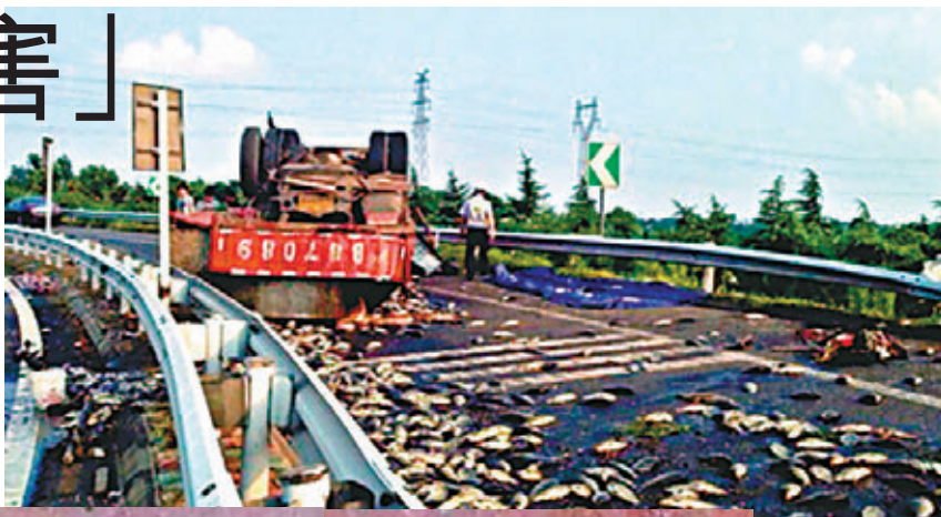
鎮江載魚車事故後，落地的上萬條新鮮魚竟被「煎熟」。網上圖片