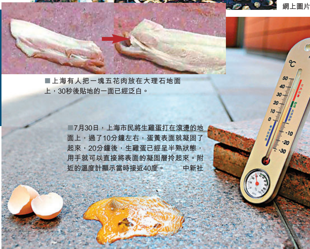
上海有人把一塊五花肉放在大理石地面上，30秒後貼地的一面已經泛白。

重症中暑又稱熱射病，主要是持續悶熱，引起人體體溫調節功能失調，汗液無法正常排出，體內熱量過度積蓄，導致多器官功能衰竭。然而並不是只有暴曬才會中暑，有時在室內也會中暑，尤其是體質虛弱或患有基礎性疾病的老年人，更容易在沒有使用空調的情況下發病。