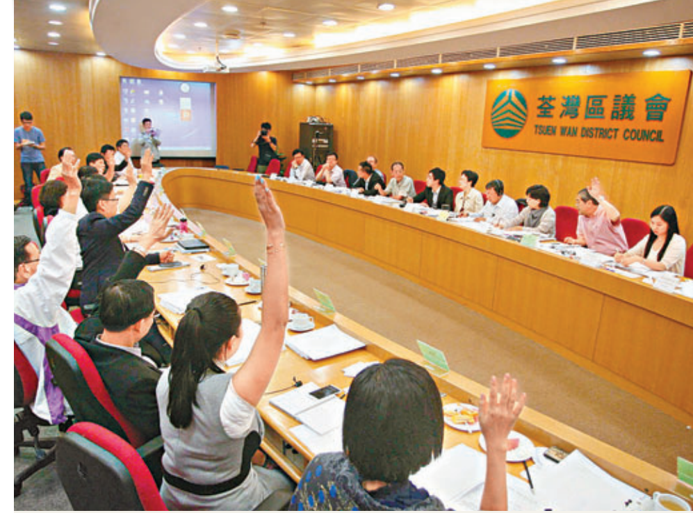
▲荃灣區議會昨日以12票贊成、3票反對通過反「佔中」動議。