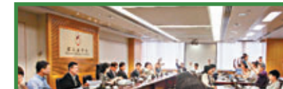
▲離島區議會昨日通過反「佔中」動議。