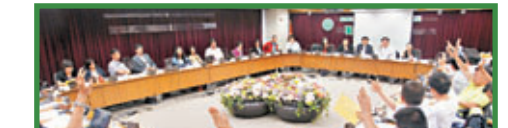
▲葵青區議會昨日通過反「佔中」動議。

離島區議會向「佔中」說「不」的聲言同樣熾熱。6月24日，該會大比數通過一項「要求維護香港法治核心價值」的反「佔中」動議。大部分發言區議員均認為，「佔中」行動影響離島居民的正常生活及旅遊業發展，質疑「佔中」倡議者應負責任地要求政府部門維護法治保障市民權益。由於她訴求擾亂社會秩序，破壞香港經濟及形象，促請警方全力執法，維護香港法治。