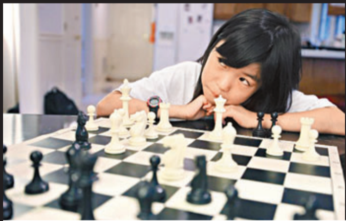
卡里莎目標是晉升大師級，更希望有朝一日成為美國首位女棋王。