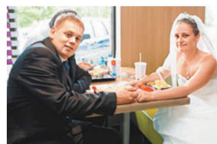
阿舍夫婦反傳統在麥記宴客。

婚宴選址通常豪華浪漫，然而英國有新人一反傳統在麥當勞宴客，紀念在快餐店拍拖的浪漫回憶。婚宴僅花費150英鎊(約1,789港元)，既划算又別具意義。