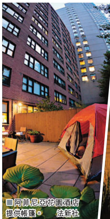
阿菲尼亞花園酒店提供帳篷。

身處美國紐約的石尿森林，想在市中心抬頭仰望星空，似乎難過登天，不過當地有酒店最近推出五星級露天套房，讓住客一嘗看星星，與天際線共眠的滋味。套房配以雙人大床、一頓燭光晚餐、煙火效果、現場爵士樂表演，以及賞星用的大型望遠鏡，每晚盛惠1,995美元(約1.5萬港元)。有住客表示，體驗過這種奢華的「城市露營」後，再不想去傳統露營。