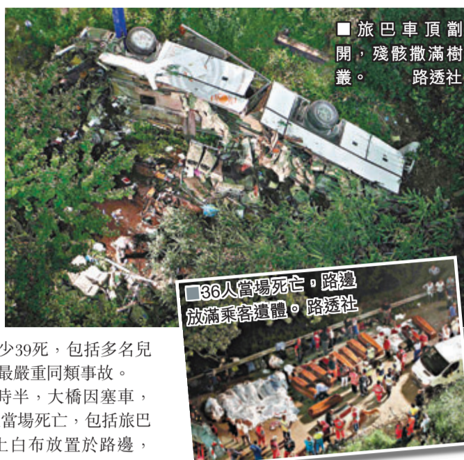
旅巴車頂劃開，殘骸撒滿樹叢。

繼西班牙火車出軌死亡事故後，歐洲發生5日內第2宗嚴重交通意外。意大利南部那不勒斯附近一架載有約50人的滿客旅遊巴士日前在一條雙線高速公路橋上落斜失控，高速撞向護欄，飛墜至30米深谷，造成至少39死，包括多名兒童，是近年歐洲最嚴重同類事故。