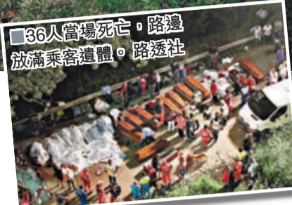
36人當場死亡，路邊放滿乘客遺體。