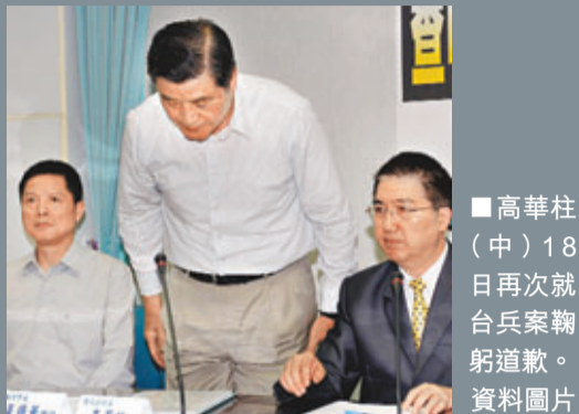
高華柱(中)18日再次就台兵案鞠躬道歉。資料圖片