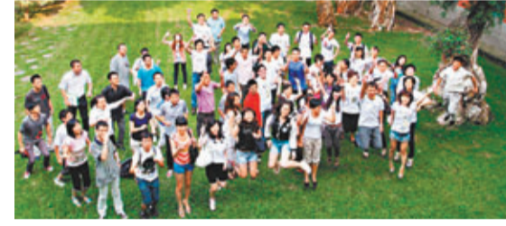
2011年準備入讀台灣大學的陸生合影。網上圖片

關注「跨海戀」議題的台灣佛光大學社會系教授陳憶芬分析，主要是目前台灣當局針對大陸學生的規定中，要求「學成返陸」，即陸籍學生完成學業後，必須回到大陸，不能留台工作。這使不少正在熱戀中的「跨海情侶」最終要海峽兩岸各一方。