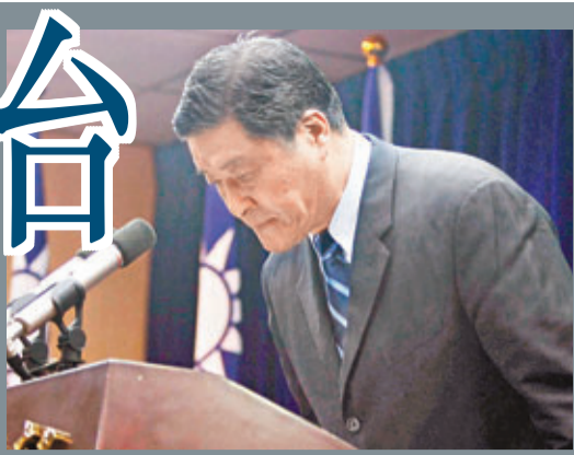
高華柱15日在記者會上，就台兵案鞠躬道歉。資料圖片

雖沒有軍旅經驗，但面對牽涉軍中人事陋習的「洪案」，他反因此可避過軍中盤根錯節的人脈網絡，可利用靈活身段為軍方「拆彈」。