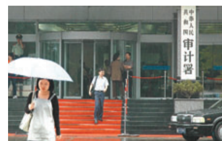
審計署將組織全國審計機關對政府性債務進行審計。

香港文匯報訊（記者 海巖 北京報導）距上屆政府跟蹤審計結束僅五個月，本屆中央政府再次啟動全國政府性債務審計。媒體報道稱，龐大的地方債務「黑洞」引發中央高度警覺，而可能超出預期的地方債務風險亦引起市場恐慌，昨日內地滬指跌破2,000點大關。據本報了解，此次中央對政府債務「大摸底」，意在摸清政府財政家底，更是為三中全會後力推的一系列改革尤其是財稅改革鋪路。有研究者預計，本次審計範圍可能擴大到中央部委以及縣以下鄉鎮，意味着這是內地首次進行覆蓋中央、省、市、縣和鄉鎮五級政府的全面債務審計，預計在10月底左右結束。