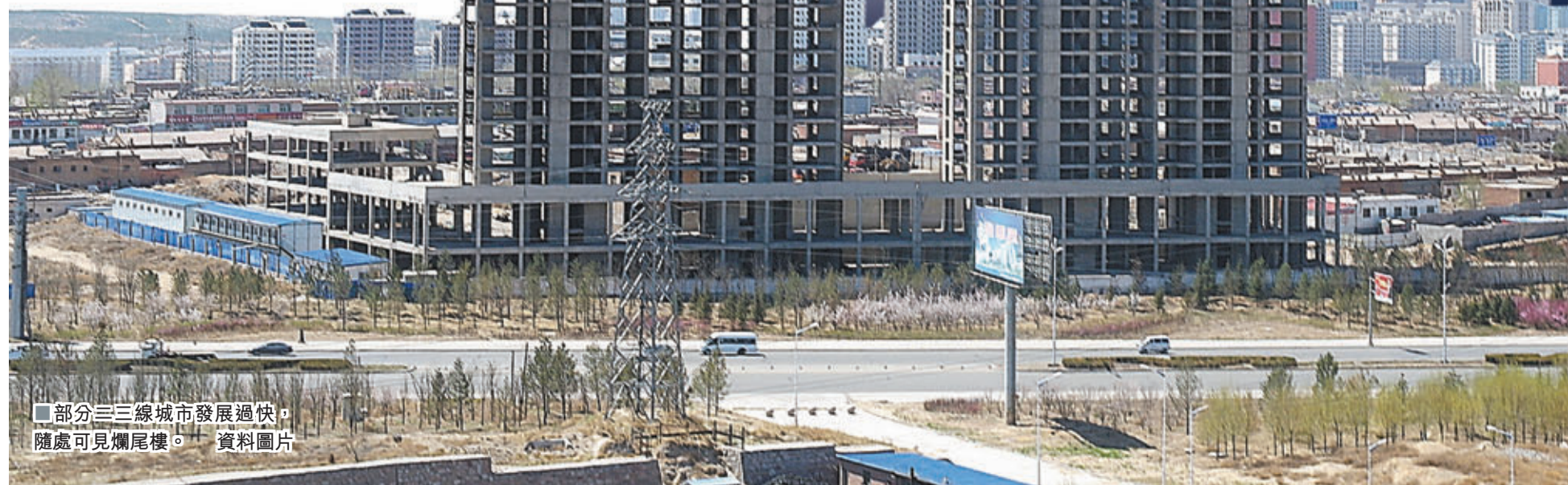
部分三三線城市發展過快，隨處可見爛尾樓。資料圖片