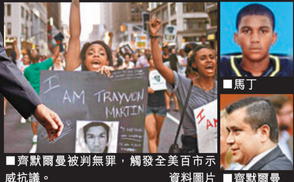
齊默爾曼被判無罪，觸發全美百市示威抗議。資料圖片