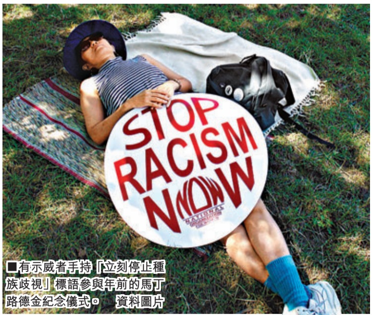
有示威者手持「立刻停止種族歧視」標語參與年前的馬丁路德金紀念儀式。資料圖片