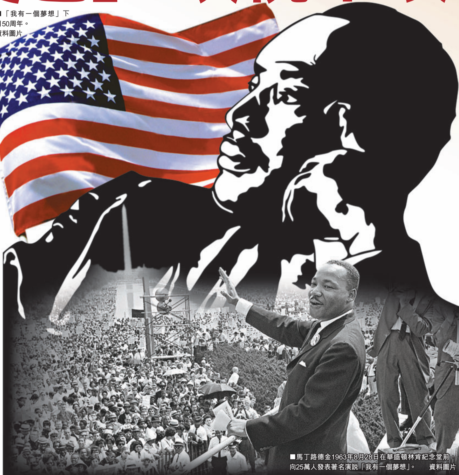
馬丁路德金1963年8月28日在華盛頓林肯紀念堂前，向25萬人發表著名演說「我有一個夢想」。資料圖片