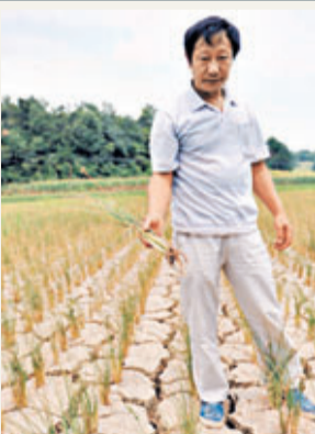
貴州旱情嚴重,稻田絕收。

湖南西部懷化市持續1個月的特重旱情仍在進一步發展,連日來的高溫酷暑天氣加劇了蒸發量,全市有54座水庫乾涸,57條溪河斷流。全市100萬畝農作物面臨減產乃至顆粒無收的嚴峻局面。大旱當前,懷化市干群上下一心,四處找水源,統籌水資源分配,疏通渠道引水,加強人工降雨力度,力爭將大旱帶來的損失降到最低。