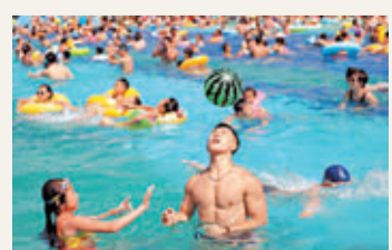
遊客戲水避暑。

持續的高溫催熱了「熱商機」。家務「外包」給鐘點工,吃飯點點鼠標上網去找,想吃水果找個「跑腿的」……常說「好漢不賺六月錢」,可持續的高溫,讓那些自稱好漢的人變成了「懶人」。這也正好成就了「跑腿一族」大賺「懶人錢」。