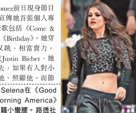
Selena在《Good Morning America》大騷小蠻腰。