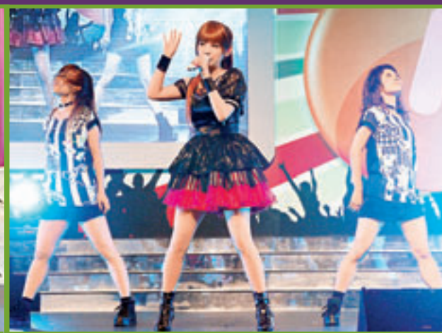
翔子前日出席動漫節活動。