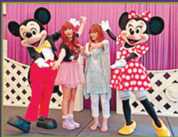
翔子在迪士尼與日本的粉絲聚會。

香港文匯報訊 日本Blog界女王中川翔子來港出席動漫節，並於今日假九展舉行演唱會。昨日她接受本報訪問，透露10年前曾是成龍旗下的藝人，可惜該部門解散才返回日本發展，又期望自己更有名時，可透過優秀人才計劃來港。