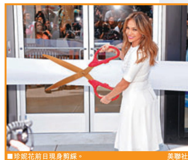
珍妮花前日現身剪綵。