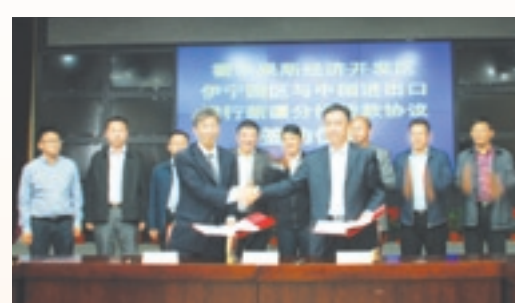
■霍爾果斯經濟開發區伊寧園區獲進出口銀行2億元貸款

伊寧園區要完成35平方公里的基礎設施建設，初步預算要投入約149億元的巨額資金。「我們不等不靠，先行先試，國務院《關於支