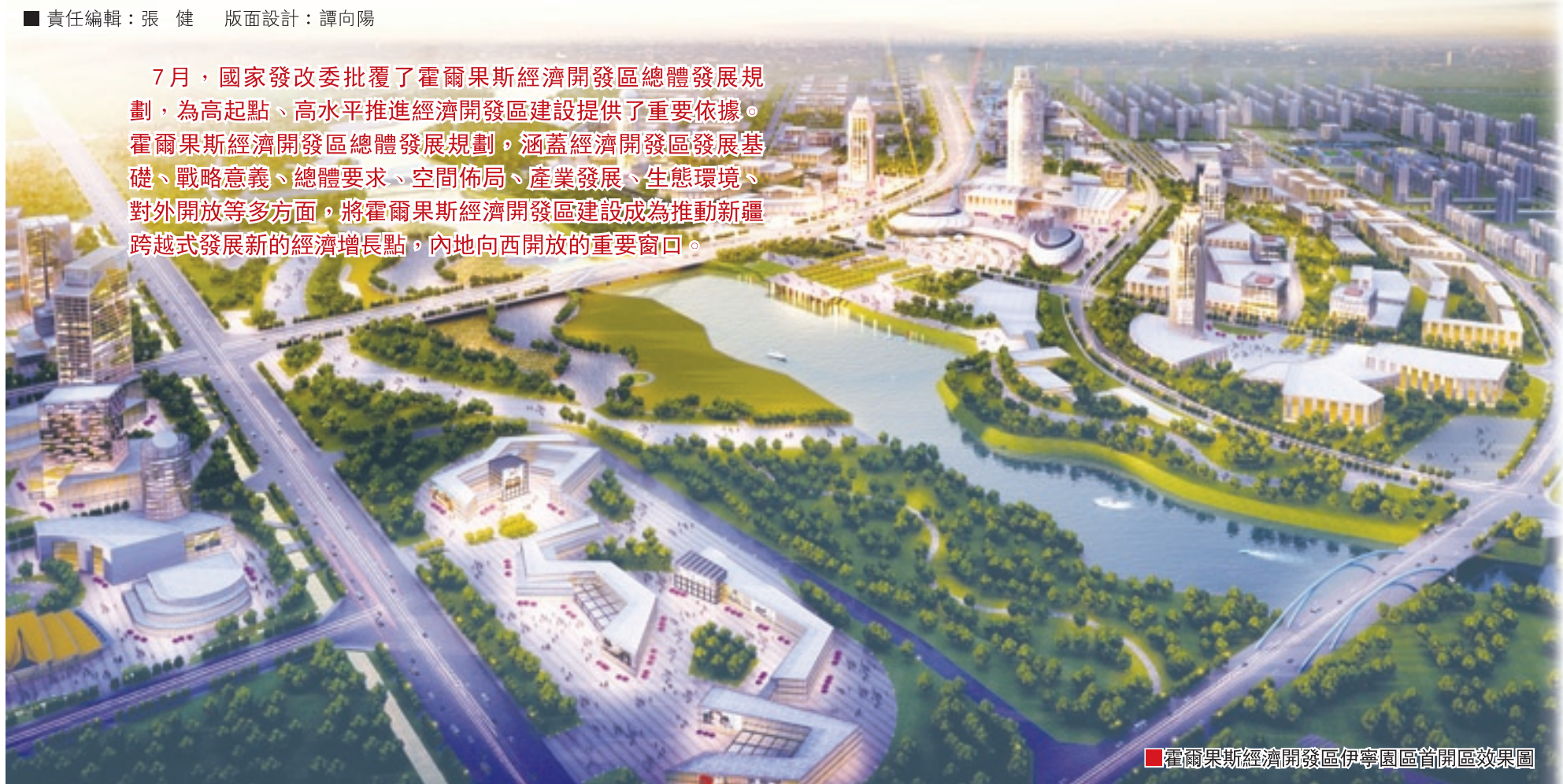
■霍爾果斯經濟開發區伊寧園區首開區效果圖

7月，國家發改委批覆了霍爾果斯經濟開發區總體發展規劃，為高起點、高水平推進經濟開發區建設提供了重要依據。霍爾果斯經濟開發區總體發展規劃，涵蓋經濟開發區發展基礎、戰略意義、總體要求、空間佈局、產業發展、生態環境、對外開放等多方面，將霍爾果斯經濟開發區建設成為推動新疆跨越式發展新的經濟增長點，內地向西開放的重要窗口。