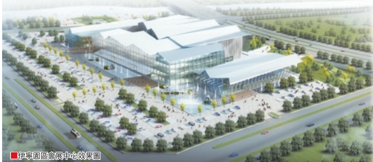
■伊寧園區會展中心效果圖

此前，註冊成立的伊寧經濟技術開發區惠寧投資建設有限公司註冊資金3.83億元，目前淨資產已達4.6億元，部分資產還在注入過程中，資產注入後市值可達18億元以上，以此進一步擴大融資渠道和規模。