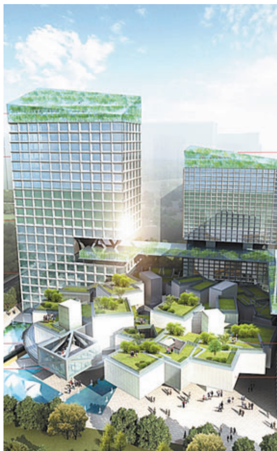
立體城市壹號效果圖。 本報西安傳真

香港文匯報訊(記者 熊曉芳 西安報導)內地首個「立體城市」——西咸立體城市暨「立體城市壹號」項目昨日在陝西省西咸新區正式啟動建設。預計將在未來7年內投入300億元,打造一個容納8萬常住人口的微型城市。業內人士認為,立體城市作為市場化推進城市發展的新模式和中國城鎮化改革的大膽試驗,將對中國乃至世界城市發展產生重要影響。