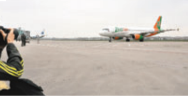
使用中的泉州晉江機場,能滿足波音757等同類機型的起降要求,候機樓面積5.5萬平方米,可停靠15架大中型飛機。

據泉州府發改委透露,新機場選址已完成選址報告、飛行程序設計等8項報告,以及選址報告編制所需的環境影響、水土保持、生態影響等專題報告的編制工作,並報送上級機關和有關部門待審查。據悉,目前正在規劃的廈漳泉城際軌道交通2號線,也已規劃連接大港灣新機場。