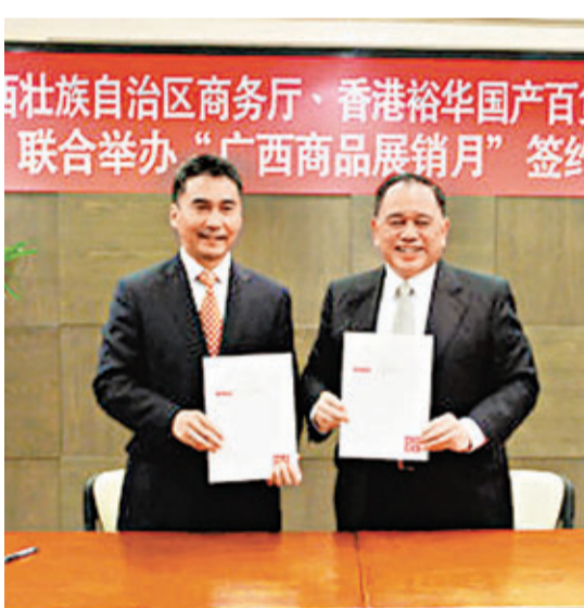
廣西商務廳與裕華百貨早前簽訂合作協議。

香港文匯報訊(記者 曾萍 南寧報導)廣西壯族自治區商務廳和香港裕華國貨日前聯合在南寧舉辦的「香港廣西商品展銷月採購會」。據了解,有廣西特色食品、陶瓷器具、傢俱用品、成藥、蠶絲製品等六大類逾130家廣西名廠、近千種產品參加採購會。雙方期望通過此次活動,宣傳和推廣廣西優良的投資環境及產品,共同為桂港經濟發展做貢獻。