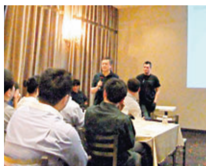
海信再度啟動規模宏大的「北美融智」活動。

香港文匯報訊(記者于永傑 山東報導)7月17日,海信再度啟動規模宏大的「北美融智」活動。首站自加拿大多倫多開始「招賢納士」,此後還將赴密西沙加、渥太華、蒙特利爾、波士頓和硅谷五個城市舉辦北美人才招募與座談會。面向通信、IT、多媒體、智能信息系統、製冷、暖通、醫療電子等領域提供100多個高端職位,從技術研發到產品設計,從市場營銷到中高層管理,職位涵蓋眾多技術領域,遍佈世界多個地區。