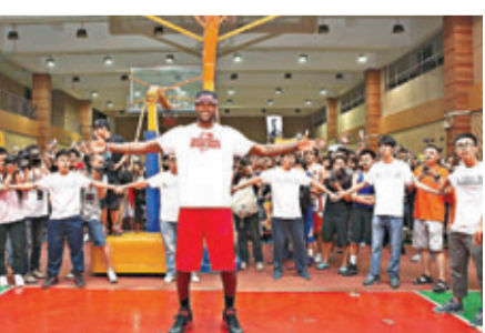
正訪問廣州的勒邦占士。

此外,另一支NBA老將、35歲內線簡安馬田的經紀人米拿透露,簡安馬田已經與紐約人達成協議,在下季將繼續為紐約人效力。簡安馬田在上季中途加盟紐約人,為紐約人出戰了18場常規賽,場均可以得到7.2分和5.3個籃板,為紐約人鎖定東岸第2名立下了汗馬功勞。