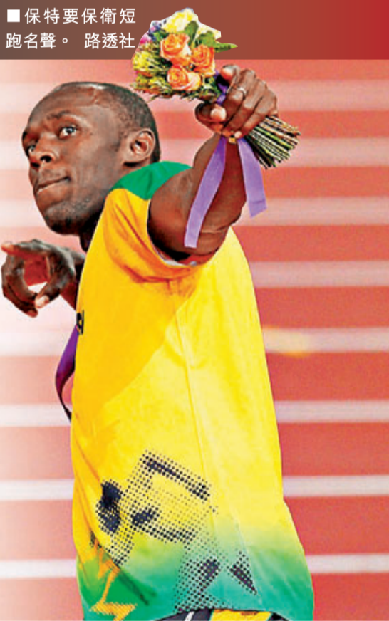
保特要保衛短跑名聲。