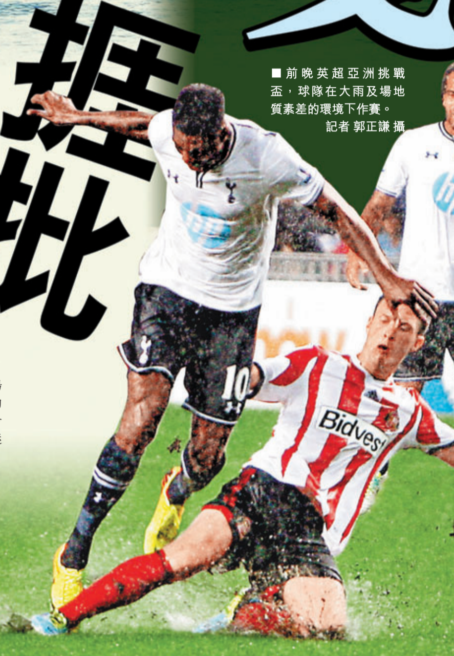
前晚英超亞洲挑戰盃,球隊在大雨及場地質素差的環境下作賽。