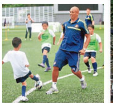
新特蘭中堅布朗(右)與小朋友過招。

香港文匯報訊(記者 郭正謙)英超球星變身「大細路」雨戰群童!昨日舉行的英超社區足球節,雖然未獲天公造美,不時下起滂沱大雨,不過一班千萬身價的英超球星,卻願意齊齊放下身段,冒雨與一眾小朋友打成一片,對簽名拍照要求來者不拒,盡顯親切一面。