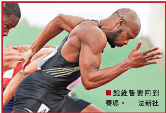
鮑維誓要回到賽場。

另外,隨著基爾、鮑維、辛普森等一批世界短跑名將在興奮劑檢測中被查出使用違禁藥物,田徑界的興奮劑醜聞風波愈演愈烈。國際田聯將在下一個月的莫斯科田徑世錦賽上進行一次全面的興奮劑檢測,以重新樹立國際田徑運動的形象。