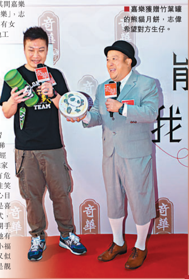
嘉樂獲贈竹葉罐的熊貓月餅，志偉希望對方生仔。

仔，個女長大便靚女，現時她四個月大，重16磅。」問到嘉樂是否想追多個？他承認考慮中，仔女都沒所謂。說到翁靜晶亡夫劉家良向邵氏追討電影花紅，對此，志偉不作回應，嘉樂覺得這是別人家事，不明內裡的事，外人不能給太多意見。