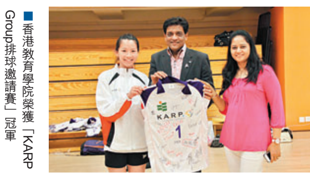
香港教育學院榮獲「KARP Group排球邀請賽」冠軍

第一屆「KARP Group排球邀請賽」於上月29日順利舉行。是次邀請賽由KARP Group珠寶公司贊助舉辦,有4支女子排球隊伍參加此次比賽,包括R.S.女子排球、蘇屋女子排球、嶺南大學女子排球及香港教育學院女子排球。經過一輪緊張刺激的比賽,香港教育學院榮獲是次比賽冠軍。