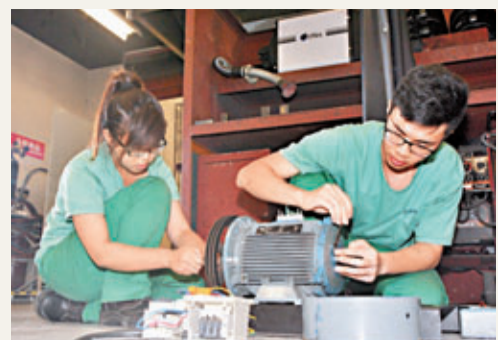
港鐵將增聘逾100名技術學員,提供3年至4年的維修受薪培訓。

他又稱,參考77間受訪公司的意見,其中有51.8%受訪公司預期勞動市場需求增長可觀及溫和,故相信日後金融服務、物業發展與管理及製造與酒店業的招聘情況可更為顯著,並預期勞動市場短期內仍然活躍;至於業務發展較為蓬勃的行業,在招聘及挽留方面或會面對較大挑戰,因此制定具競爭力、有效及靈活的薪酬制度,將繼續是僱主及人力資源管理專才的重大考驗。