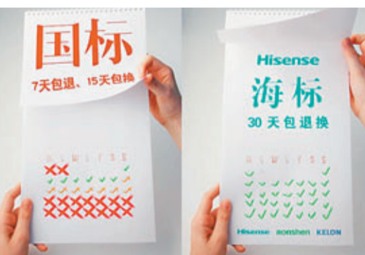
海信實施實施「30天包退包換」新政 資料圖片

香港文匯報訊(記者 于永傑 山東報道) 7月23日,海信(Hisense)通過其官微宣佈即日起旗下海信(Hisense)、容聲(Ronshen)、科龍(Kelon)三大品牌所有消費電子、家用電器全管道(線上、線下)實施「30天包退包換」,這與「7天包退、15天包換」的國標相比,延長了一倍多。而記者查閱資料顯示,這也是與歐美國家相比除沃爾瑪90天包退換之外「三包」政策最寬容的政策。