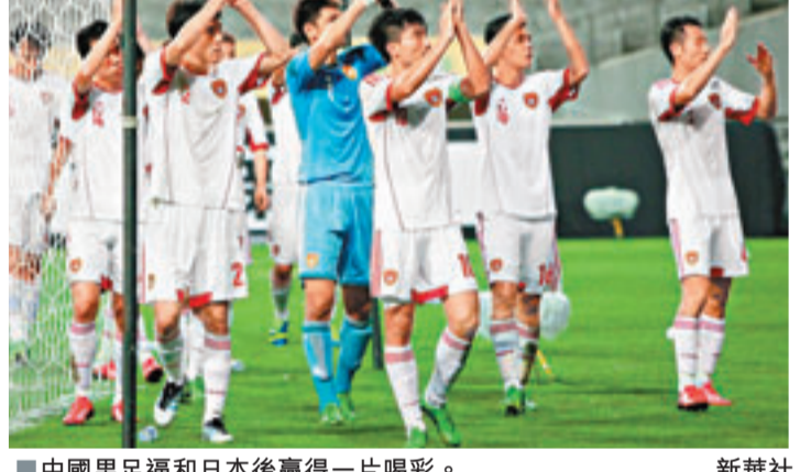
中國男足逼和日本後贏得一片喝彩。