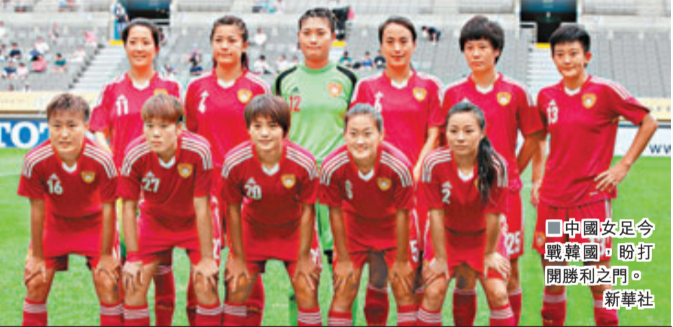
中國女足今戰韓國，盼打開勝利之門。