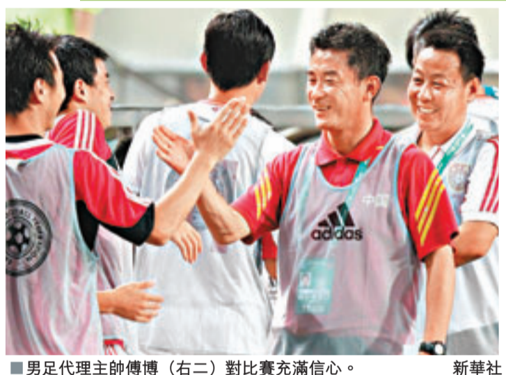
男足代理主帥傅博(右二)對比賽充滿信心。