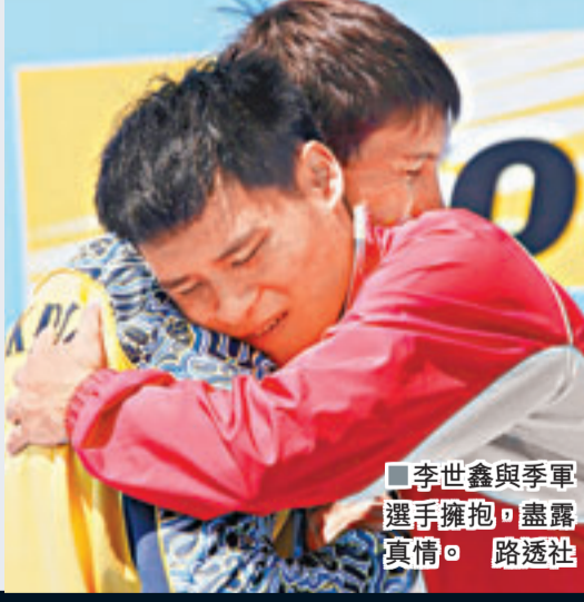
李世鑫與季軍選手擁抱，盡露真情。