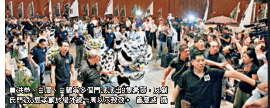
■ 洪拳、白眉、白鶴等多個門派派出9隻素獅，及劉氏門派3隻孝獅於場外繞一周以示致敬。