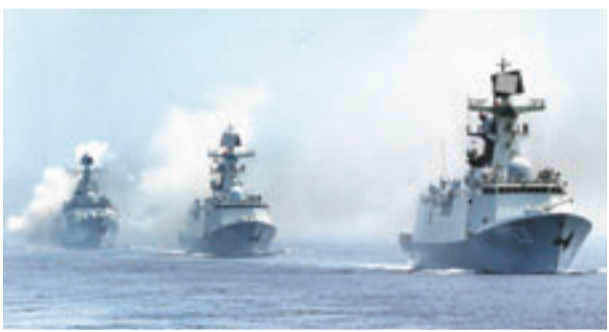
■本月初，中俄舉行「海上聯合-2013」軍事演習。資料圖片

香港文匯報訊（記者 葛沖 北京報道）中俄「和平使命-2013」聯合反恐演習27日即將拉開戰幕。據報道，中俄軍方已完成聯合軍演規劃，演習將分三階段進行，解放