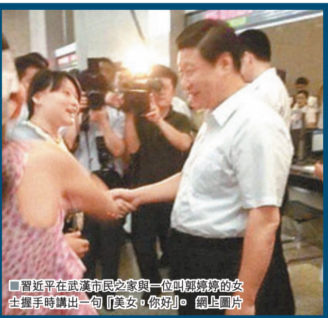
■習近平在武漢市民之家與一位叫郭婷婷的女士握手時講出一句「美女，你好」。

香港文匯報訊（記者 肖晶 湖北報道）7月23日，中共中央總書記、國家主席習近平結束在湖北地區的考察調研。經過深入武漢、鄂州等地的港口、企業、鄉村、社區實地了解情況，習近平表示，轉變作風就是要打破「圍牆」，要深入群眾、多接地氣，而不能簡單作秀。