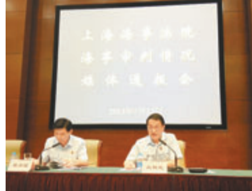
■上海海法院召開海事審判情況通報會，透露滬自貿區建設擬加強海事審判。

香港文匯報訊（記者 章蘿蘭 上海報道）備受關注的上海自由貿易區建設正在緊鑼密鼓的籌備中，必要的司法保障也在加緊制定。上海市高級人民法院副院長盛勇強23日透露，為強化對自貿區的司法保障，上海高院正在積極調研並將適時出台相關工作意見，其中加強海事審判是重要內容之一。