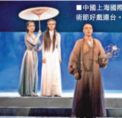
中國上海國際藝術節好戲連台。