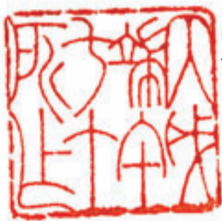
■丙戌端午。七十所作。

除印材的優劣及其選擇之外，影響篆刻效果的最重要因素便是印文的選擇和佈局安排。類似一