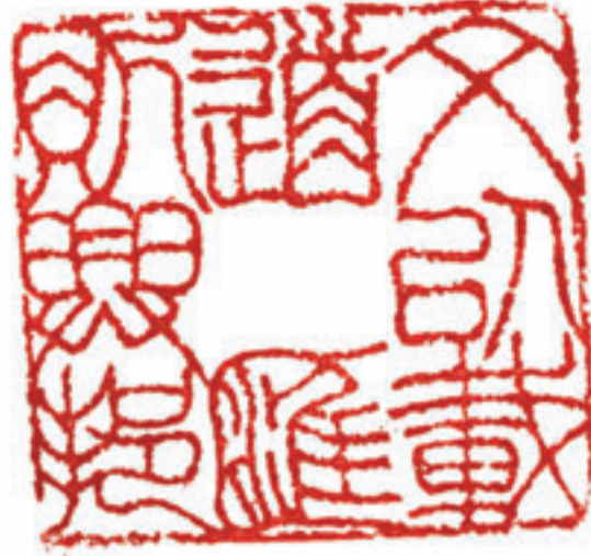
■文以載道，匯則興邦。

今天篆刻藝術在中國仍發展蓬勃，印人和印譜很多，期刊諸如《書法》每期都兼有篆刻內容。香港也有不少愛好者，常有展覽，大學校外課程也有這學科。愚意以為，篆刻是一門綜合文學書法繪畫雕刻考據金石等多方面的藝術。正如其他藝術，我以為要登峰造極成為專家，除了苦學苦練還需一些天分。不過，作為業餘的愛好者，不妨操刀嘗試，然後，多讀印譜，多方揣摩，多寫多刻，應該會自得其樂和逐漸取得進步。數年前我參觀貝聿銘設計的蘇州博物館，恰巧當時館內展出李嵐清的篆刻作品，老人家業餘能得此成績當然不