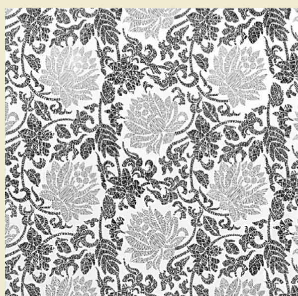
■曾建華作品《MomFDad》（白底、灰、黑色）

曾：現在我繼續在作先前的作品，如七封印、Ecce Homo Trilogy等，希望在有合適的展場及支援時，展出這些系列中未完成的部分。