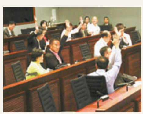
立法會通過促請政府收回粉嶺高球場的動議。

地政總署回覆傳媒有關新界收地補償安排，發言人表示，除了法定補償索索，當局亦會提供四個分區級別的特惠補償安排。發言人強調，釐定四個地區分布及特惠補償率，有既定機制，考慮因素包括該分區是否位於新市鎮發展區，以及已知的市鎮發展潛力，如果有關地帶位於新市鎮發展區，會評為甲區級制，而有關的特惠補償率，地政總署會每年檢討兩次，以反映市場價值變化，發展局在調整機制中沒有參與角色。