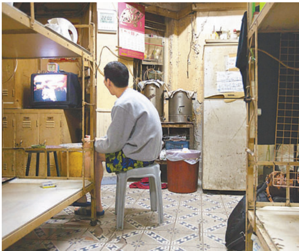
不少逾35歲的單身人士均居住在板間房，長策會正研究助這批市民早日上樓。

長策會建議三管齊下加快35歲以上單身人士獲編配公屋。房委會於2005年為非長者單身人士引入配額及計分制，申請者獲配公屋的相對優先次序，取決於其在計分制下所得分數，分數愈高，愈早配屋，分數則視乎遞交公屋申請時的年齡、已輪候時間等，現時每年獲配予非長者單身人士的公屋單位以2,000個為限。長策會建議即時為輪候冊上的35歲以上非長者單身人士加分，加快