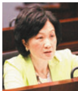
葉劉淑儀不認為陳茂波漏報利益。

政務司司長林鄭月娥昨日在回應有關問題時表示，留意到陳茂波已多次澄清，希望大家仔細看看對方解釋的內容。