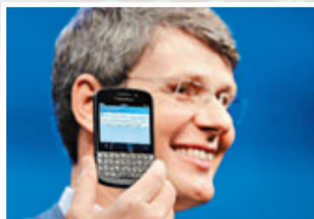
■面臨中招威脅手機：蘋果iPhone、黑莓智能手機及Google Android。

德國柏林安全研究實驗室(SRL)發現，全球最少有5億部手機的SIM卡存在保安漏洞，黑客可從遠端複製SIM卡，並盜取卡內銀行戶口等私人資料。聯合國國際電訊聯盟(ITU)指發現相當重要，計劃通報近200個成員國政府及業界，SRL將於下周三舉行的黑帽黑客會議披露更多詳情。