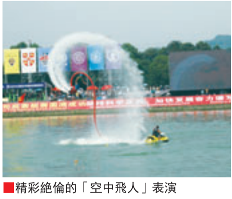
■精彩絕倫的「空中飛人」表演

油!加油!」兩岸吶喊助威聲響徹雲霄,運動員們毫不懈怠,奮力向前劃。吶喊聲、口哨聲、相機的快門聲不絕於耳。隨後,來自四川省內的10支龍舟代表隊,也下水助力陣。一時間,讓觀眾欣賞到了民俗與國際體育運動交相輝映的精彩畫卷。經過兩時間的激烈角逐,清華大學、荷蘭阿姆斯特丹大學、英國劍橋大學分獲賽艇賽男隊一、二、三名;新西蘭奧塔哥大學、法國巴黎第二大學、英國倫敦大學分獲賽艇賽女隊一、二、三名。新津縣龍舟代表隊、涼山州龍舟代表隊、成都市代表隊分獲四川省龍舟邀請賽一、二、三名。