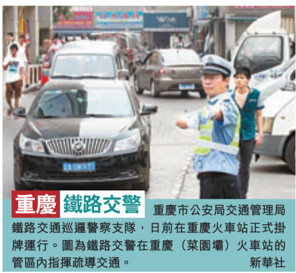
重慶 鐵路交警 重慶市公安局交通管理局鐵路巡邏警察支隊,日前在重慶火車站正式掛牌運行。圖為鐵路交警在重慶(菜園壩)火車站的管區內指揮疏導交通。

香港文匯報訊(記者 翁舒昕 福州報導)福建省福州市推出大學生家政人員免費培訓計劃,吸引超過200名大學生報名。同時,首期培訓的30多名大學生已經被預訂一空。據悉,該批大學生保母持證上崗後,月薪預計在1,500元至2,500元之間,較普通保母的月薪低。