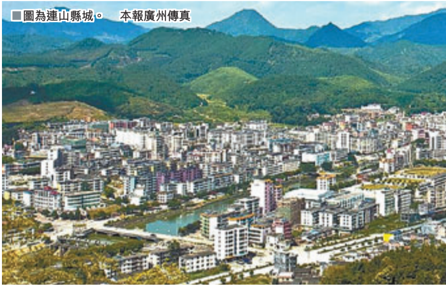
■圖為連山縣城。

香港文匯報訊(記者 古寧 廣州報導)廣東將研究設立少數民族科學發展試驗區。知情人士日前透露,廣東民族地區與經濟發達地區相比仍有較大差距,連南、連山、乳源3個少數民族自治縣去年人均GDP僅相當於廣東全省人均水平的43.4%,財政自給率低廣東平均水平57個百分點。