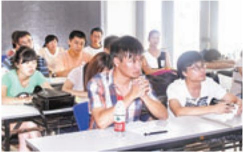
■首批大學生保母在接受集中培訓。

香港文匯報訊(記者 翁舒昕 福州報導)福建省福州市推出大學生家政人員免費培訓計劃,吸引超過200名大學生報名。同時,首期培訓的30多名大學生已經被預訂一空。據悉,該批大學生保母持證上崗後,月薪預計在1,500元至2,500元之間,較普通保母的月薪低。