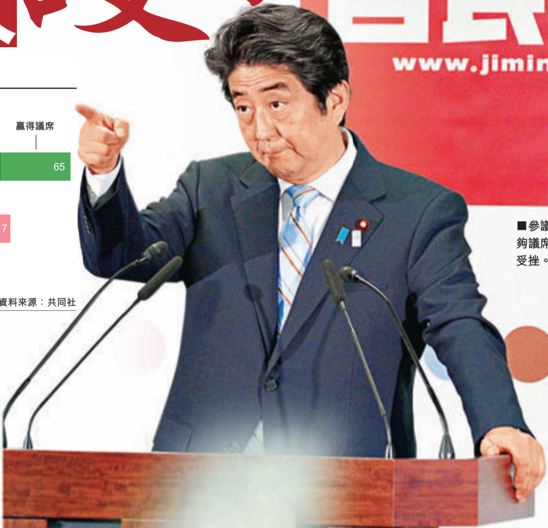
■參議院改選未獲得足夠議席，安倍修憲圖謀受挫。