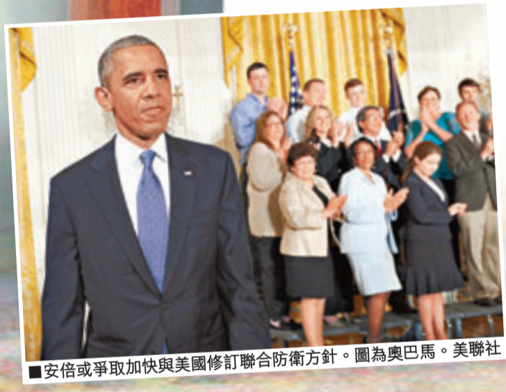
■安倍或爭取加快與美國修訂聯合防衛方針。圖為奧巴馬。