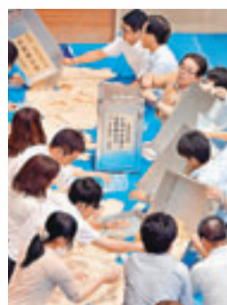
■選舉投票率低，反映選民冷淡。圖為票站職員點票。