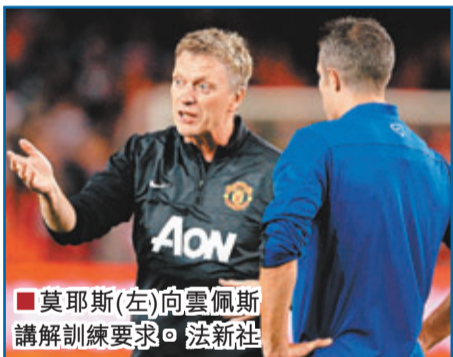
莫耶斯(左)向雲佩斯講解訓練要求。

一位蘇格蘭記者問莫耶斯，是否準備好與摩連奴來一場智鬥，莫耶斯回答：「我們對於朗尼的態度並未改變，我們那兒的人對於智力運動普遍都很熱衷，所以我的答案是：儘管放馬過來！」