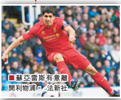
蘇亞雷斯有意離開利物浦。

蘇亞雷斯加盟阿仙奴？在英國媒體看來，這件事成真的可能性越來越大，據《每日郵報》和《鏡報》報道，蘇亞雷斯本人很願意加盟阿仙奴，但在阿仙奴面前的或許是轉會費這個難題，利物浦想要一份超過5000萬英鎊的報價。