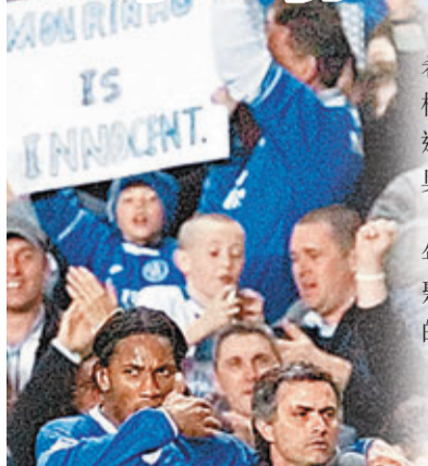
摩連奴會跟杜奧巴在車仔重聚嗎？

據英格蘭媒體報道，摩連奴重回車路士後希望能將昔日愛將杜奧巴重新帶回史丹福橋，但事情看起來並不順利。據《鏡報》報道，車路士希望用一份球員兼教練合同把杜奧巴重新簽下。