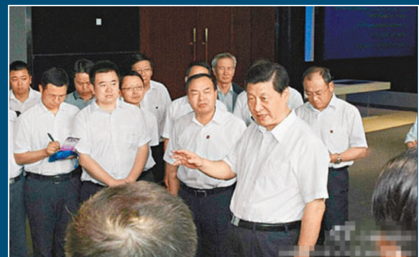
■習近平在武漢東湖國家自主創新示範區考察。