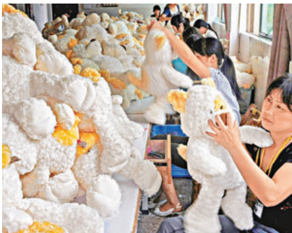
■歐盟市場上80%以上的玩具是從中國進口。圖為內地一家玩具製造企業。 資料圖片

中國商務部新聞發言人姚堅建議，玩具生產企業除了積極應對標準的變化，更應提升整體競爭力，「我們的企業還是有很多的積極的因素、積極的辦法來提升他們的競爭力。比如他們積極研發新產品、特色產品，培育自主品牌的產品、創新經營的模式。用學術一點的名詞講，就是延伸價值鏈，由以前企業只承擔製造環節，延伸到上游的產品的設計、品牌、原材料的供應和下游的銷售渠道。」