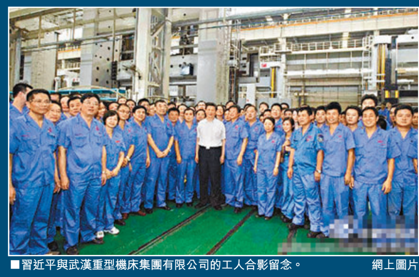
■習近平與武漢重型機床集團有限公司的工人合影留念。

武漢從20日起連降大雨，多處積水，即便撐傘外出，衣褲鞋襪亦不能倖免於被雨水打濕。21日上午11時13分，習近平的車隊悄然駛入陽邏港區，在聽取關於武漢新港和武港集團的建設發展情況的匯報後，他決定前往碼頭裝卸平台查看。