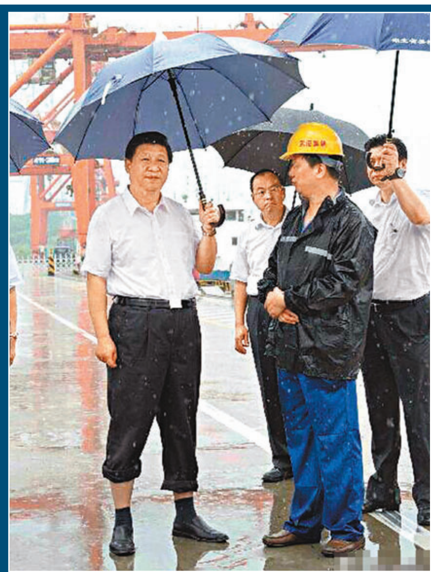
■習近平打着傘、捲起褲管在武漢新港陽邏集裝箱港區考察。

分析人士指，習近平抵達湖北，首先即從航運物流和科技創新兩方面考察武漢最具競爭優勢的增長點，並指出希望打造長江全流域黃金水道，無疑是對武漢作為長江中游重要航運樞紐「牽一髮而動全身」的重要地位的肯定，而關於科技創新方面的論述更是對部署了國家自主創新示範區的武漢寄予厚望。習近平的到訪為正以國家中心城市為發展目標的武漢注入強大信心和動力。