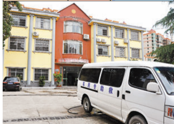
救助梁×偉的永州市救助站。