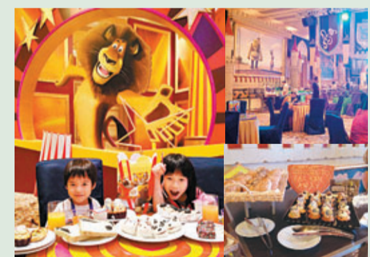
■「體驗夢工場」動畫明星早餐，大家將可在經過精心佈置的宴會廳內享用早餐，猶如置身在電影情節當中，DreamWorks動畫人物還會來到現場與各位酒店住客作近距離接觸。