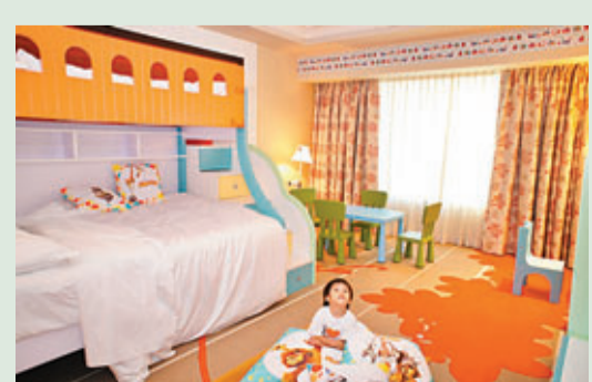
■這兒是澳門喜來登酒店「獨家夢工場主題家庭套房」，三款以《史力加》、《功夫熊貓》、《荒失失奇兵》的造型打造，小朋友甚為喜歡。