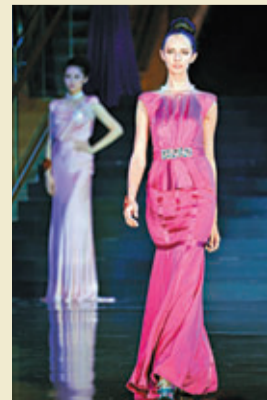
■在比賽中的俄羅斯選手娜塔莉亞·多鄒科娃。