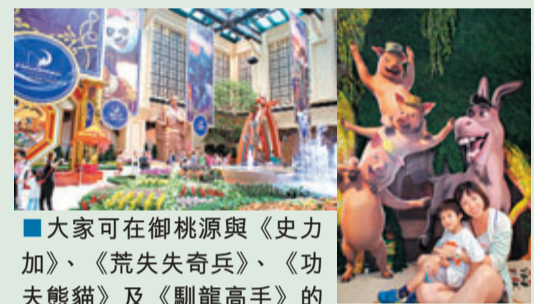
■大家可在御桃源與《史力加》、《荒失失奇兵》、《功夫熊貓》及《馴龍高手》的DreamWorks動畫人物見面及與他們盡情拍照。