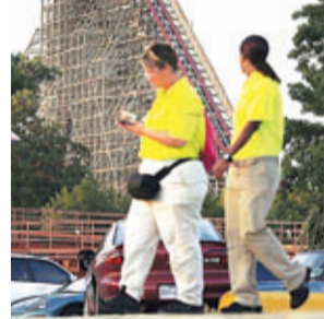
■發生意外的過山車已關閉。

美國一名女遊客前日在得州阿靈頓市著名的六旗遊樂園，乘坐全球最高鋼木混合結構過山車「得州巨人」時，從高處墮下死亡。有目擊者稱，過山車下行時安全桿鬆開，該女子直接翻滾下來。其他人稱，她和兒子一起坐過山車，