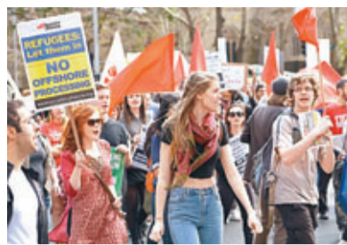
■悉尼民眾示威，要求政府收留船民。

澳洲總理陸克文前日宣佈暫停接收船民，位於瑙魯的難民營隨即爆發騷亂，約150名船民到處縱火，一度佔領難民營，有多人逃脫。事件造成最少15名守衛受傷，60名船民被捕，據稱難民大部分來自伊朗，目擊者指，難民營有9成半建築物遭焚毀，場面儼如戰區。澳洲與巴布亞新幾內亞前日簽署協議，乘船抵達澳洲申請庇護的人不得以難民身份定居，而會送往巴布亞新幾內亞作進一步甄別，若不是難民將遣送回國或送往第三國。協議有效期是一年。