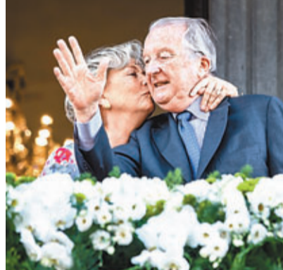
■阿爾貝二世(右)前日公開露面，王后在旁送上親吻。