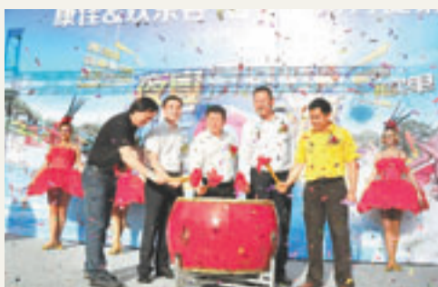
康佳聯手歡樂谷推銷彩電贈門票，以促進彩電銷售。

香港文匯報訊(記者 李昌鴻 深圳報道)為了促進暑期彩電的銷售，康佳聯手歡樂谷在內地進行聯合營銷推廣。康佳多媒體事業部總經理林洪濤稱，凡消費者在暑期購買康佳指定彩電機型，便可獲贈一張價值相當歡樂谷景區的門票，可在北京、上海、成都、深圳、武漢、天津等全國幾大城市的歡樂谷主題景區免費盡情暢遊。