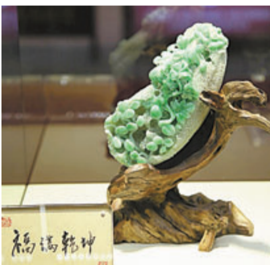
會上展出的高端翡翠「福滿乾坤」。

覽會卻一舉吸引十餘國數千珠寶商，並着力打造泛亞地區寶石、觀賞石、建材石三塊石頭的最大交易平台，引起業內人士關注。