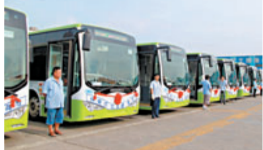
首批30輛純電動公交車在長沙交付使用。

作為全國首批節能與新能源汽車示範推廣城市之一,長沙自2009年來已成功推廣使用混合動力公車約1200台。