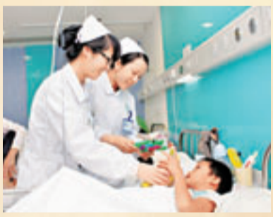
上海公立醫院改革後,相信會為市民帶來更好服務質量。

任雁明表示,下一步,必須改革分配模式,建立以工作量、人員成本、工作績效為基礎的工資總額核定辦法;改變按業務收入提取的內部分配方式,建立基於醫務人員績效考核的收入分配辦法,將崗位工作量、服務質量、規範服務、費用控制、患者滿意度等績效考核結果