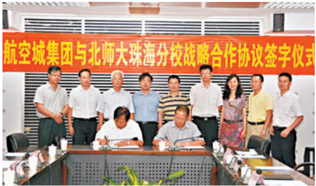
高校與當地龍頭企業合作,共同推動「珠海國際航空樂園」項目建設。 記者 張廣珍

香港文匯報訊(記者 張廣珍 珠海報導)一個集航空休閒娛樂、航空博覽、航空運動等多個功能於一體,規模堪比迪士尼的國際航空樂園有望落戶珠海。近日,北師大珠海分校與珠海航空城發展集團簽署戰略合作協議。雙方將在通用航空人才培養、通航運營、學術研討等諸多領域開展全方位的合作,並共同推動「珠海國際航空樂園」等項目的建設。