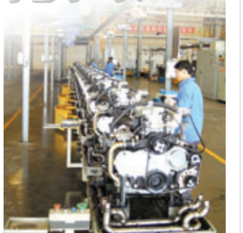
雲內動力發動機生產線(000903)的發動機製造產業,到「十二五」末,昆明經開區汽車產業保守估計產值可達400億元。(特刊)

除了固有的五大支柱產業,近年來,借助區內「昆明出口加工區」的優惠政策,昆明經開區打造了一批新興龍頭產業。其中,珠寶玉石已引進了紫雲青島項目,明年即可實現產值200億元,屆時,毛料玉石可以直接從緬甸進入雲南,進入出口加工區的保稅區,從而實現玉石毛料「保稅」功能下的批量加工。在「保稅」的狀態下,商人可以根據最後的真實價值進行分類報關和處理,大大降低了原料交易的風險。整車銷售業同樣發展喜人,截止今年年底,將會有54家4S店入駐,連同雲內動力