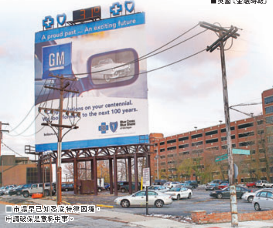
■市場早已知悉底特律困境，申請破產是意料中事。