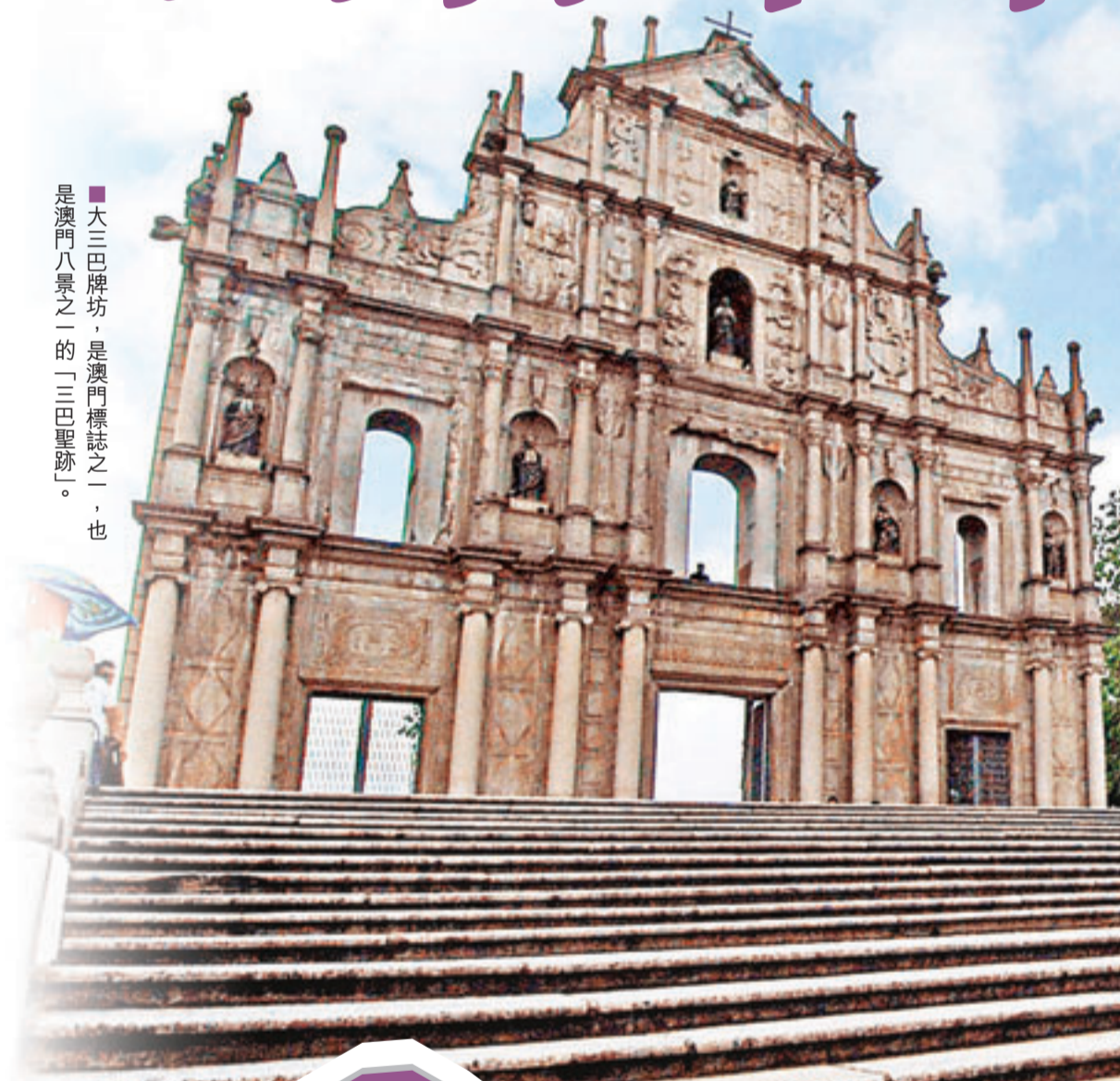
■大三巴牌坊，是澳門標誌之一，也是澳門八景之一的「三巴聖跡」。

■盧家大屋反映了澳門中西建築風格合璧的民居特點 開放時間：逢星期六、日及公眾假期9:00-18:00 地址：澳門半島大堂巷7號 免費入場