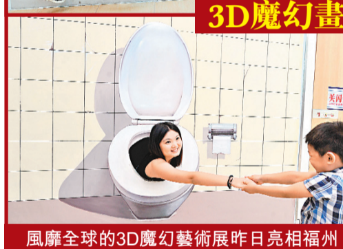
風靡全球的3D魔幻藝術展昨日亮相福州，40餘幅極具立體感的3D魔幻畫作，吸引眾多民眾前來體驗。