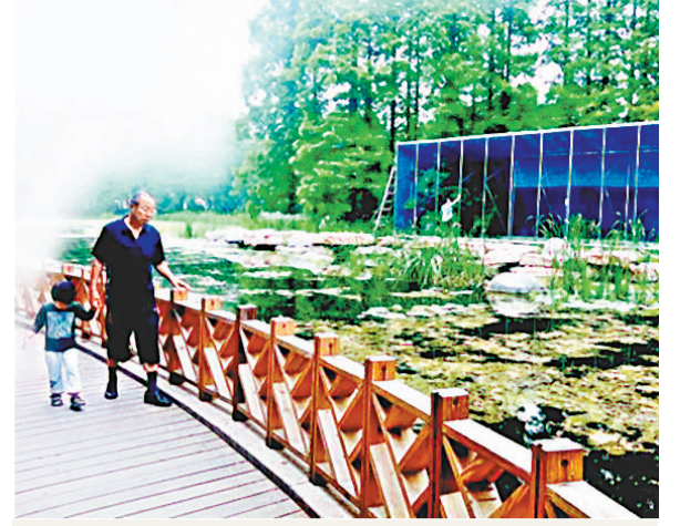
市民可以在公園內觀賞螢火蟲的閃亮表演。