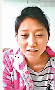
李舒預早自拍賀婚片。