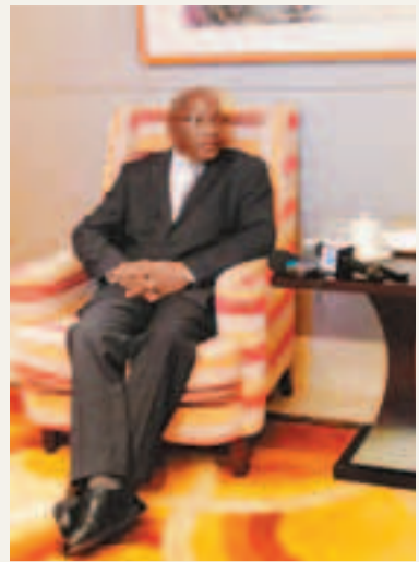
■蘭加指,南非與香港在金融業有良好合作。

香港文匯報訊(記者 于珈琳 瀋陽報道)近年,中國逐漸佔穩非洲第一大貿易夥伴地位,而非洲則是中國增長最快的出口目的地和貿易夥伴。特別自今年4月中國國家主席習近平首次出訪非洲後,部分非洲國家與中國的貿易逆差正得到逐步改善,中非貿易在農業、製造業、旅遊業等多領域趨勢利好。