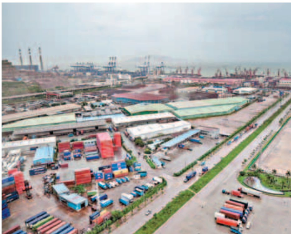
■深圳政府重新規劃蛇口港,將建設為國際郵輪母港。

目前,深圳地鐵2號線延伸到該片區,而在深圳政府的遠期規劃中。這裡也將成為15公里濱海長廊的起點,並為深圳發展的重要戰略節點,承接香港服務業的重要戰略平台。業界人士預計,工程建成後,整個蛇口區域的人流量每年至少會增加180萬人次,蛇口太子灣國際郵輪碼頭有望同香港迪士尼樂園並列,成為深港西部旅遊帶的「雙核」。