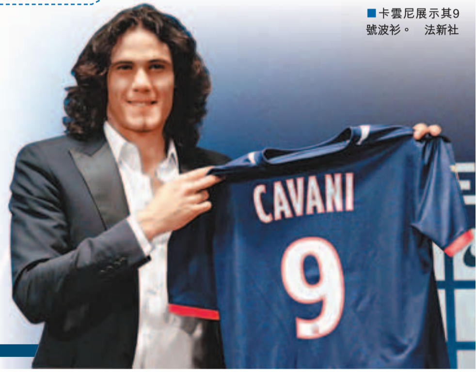
卡雲尼展示其9號球衣。

今年26歲的卡雲尼是一名極具衝擊力的中鋒。2007年，年僅20歲的卡雲尼便在南美地區U20錦標賽上穿起了金靴，此後他在意甲賽場上也是風光無限，獲得了「角鬥士」的綽號。2012/2013賽季，卡雲尼以29個入球獲得了意甲聯賽金靴獎。據法國媒體報道，巴黎聖日耳門為卡雲尼開出的年薪高達1000萬歐元。