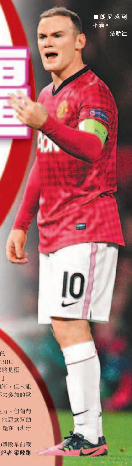
朗尼感到不滿。