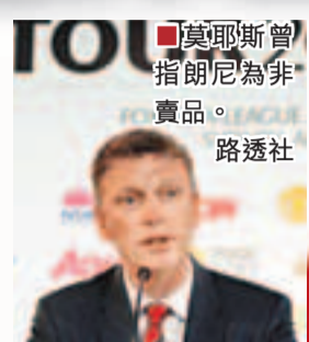
莫耶斯曾指朗尼為非賣品。