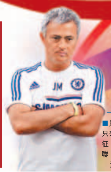
摩連奴只想帶隊征戰歐聯。

曼聯中堅李奧費迪南昨日在悉尼率先推出其自傳《Rio: My Decade as a Red》；席間，「李奧」更手抱一名初生嬰兒，大顯父愛。