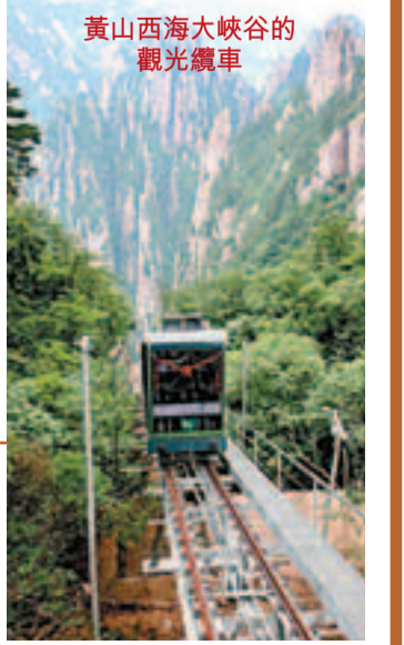
■安徽黃山風景區西海大峽谷觀光纜車全線貫通並正式投入運營，該纜車線路位於黃山西海大峽谷南側石床峰至峽谷底，係單線雙車廂往復式纜車，運行長度892.6米。 攝：新華社

龍舞南山 ■在湖南省城步苗族自治縣南山國家級風景名勝區，舞龍人展示國家級非物質文化遺產項目「城步吊龍舞」。 攝：新華社