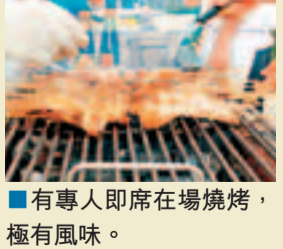
■有專人即席在場燒烤，極有風味。

暑假到了，每到周末，是否想出外走走？然而，只得兩天的時間，不能去得太遠，不妨到海泉灣兩天遊。海泉灣在珠海金灣區平沙鎮，你可先在香港港澳碼頭或中港城碼頭乘船往九洲港，大約75分鐘船程即抵埠，然後會有港中旅專車接送到海泉灣度假區，車程大約一小時。