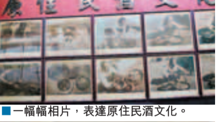
■在酒廠內，你可以了解各種酒類歷史。