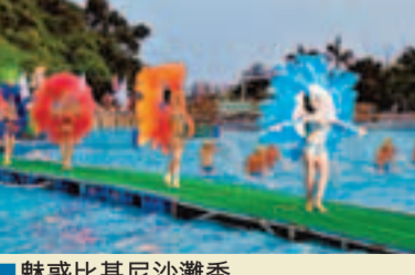
■魅惑比基尼沙灘秀