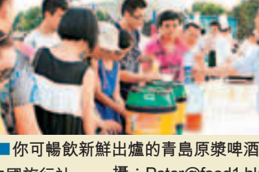
■你可暢飲新鮮出爐的青島原漿啤酒