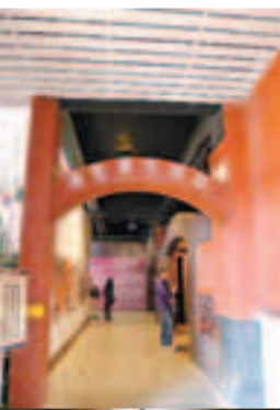
■身處酒甕隧道內，被滿佈的酒甕包圍着。