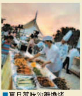
■夏日惹味沙灘燒烤