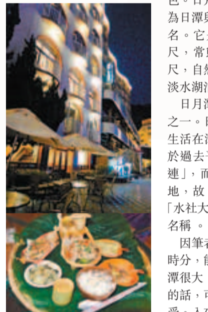
■在這間碼頭咖啡館品嚐晚餐，分外浪漫。