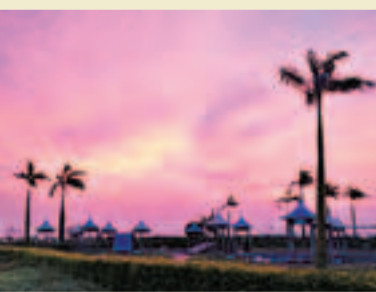
■海泉灣日落晚靚美景