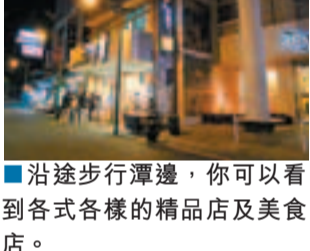
■沿途步行潭邊，你可以看到各式各樣的精品店及美食店。

■水社遊客中心為日月潭交通轉運中心，也是旅館、商店集中地，中心共有地上四層及地下一層，一樓陳設有先民文化廣場，而中心外正是乘搭南投客運往台中高鐵站的巴士站。