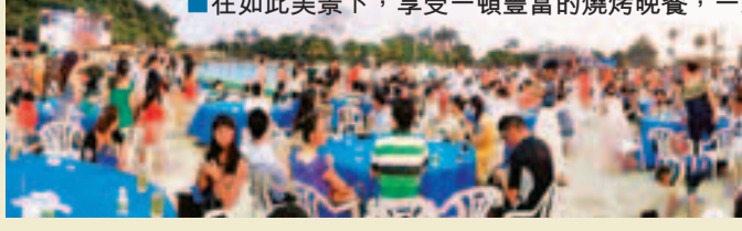
■在如此美景下，享受一頓豐富的燒烤晚餐，一樂也。