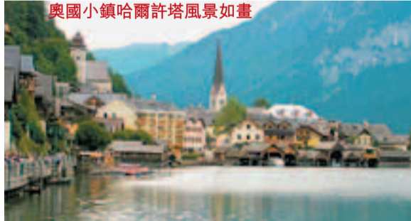
■在奧地利風景如畫湖區Salzkammergut的小鎮哈爾斯塔特(Hallstatt)是這一帶最熱門的觀光景點。中國大陸建設公司在廣東惠州打造了1個一模一樣的小鎮。