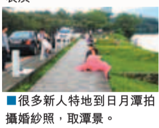
■很多新人特地到日月潭拍攝婚紗照，取潭景。