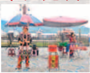
■在日月潭邊，有不少人在表演。