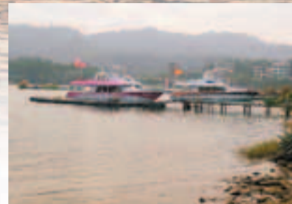
■你可乘坐遊船遊覽日月潭

因筆者是參觀酒廠後才到達，所以正值日落時分，能夠欣賞到美麗日落景致。由於日月潭很大，筆者只是在潭邊走走，如大家有時間的話，可以乘船在潭上遊覽，相信別有一番感受。入夜後筆者在這兒的潭邊找了一間食肆坐下品嚐晚餐，選了碼頭咖啡館，皆因喜歡其浪漫氣氛，其食物器皿也很特別。