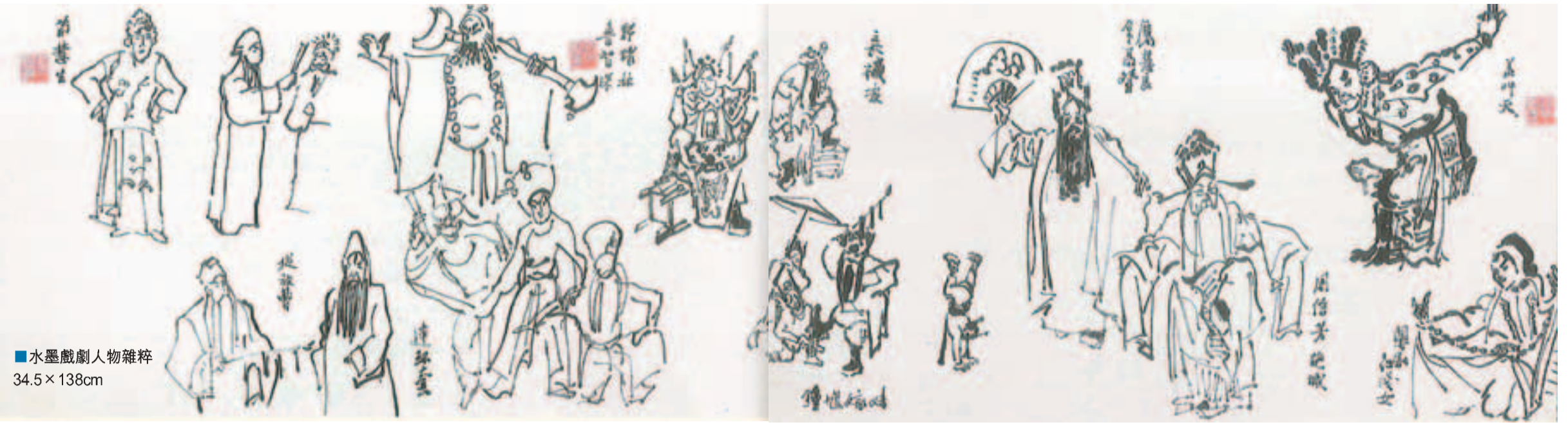
■水墨戲劇人物雜粹 34.5×138cm