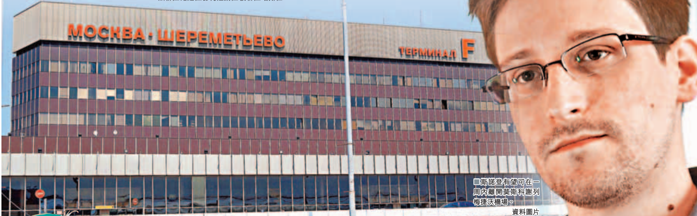
斯諾登有望可在一周內離開莫斯科謝列梅捷沃機場。