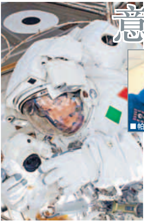
在執行任務的帕米坦諾。