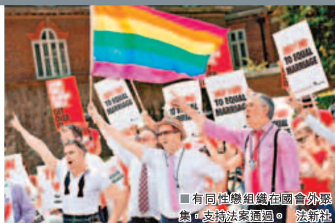
有同性戀組織在國會外聚集，支持法案通過。