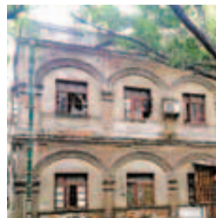
穗明心路附近的歷史建築。

香港文匯報訊(記者 古寧 廣州報道) 金陵台被強拆事件後,穗各界開始更多的關注歷史建築。廣州市規劃局有關「歷史建築普查(第一批)——歷史城區內歷史審批地塊」招標日前掛上網,普查經費預算為83萬元人民幣。業界人士指,此前,廣州已形成第一批歷史建築名錄並上報廣州市政府,但並未對外公佈。而此次則在第一批歷史建築普查基礎上再普查,估計是對已有的歷史建築普查結果進行完善。