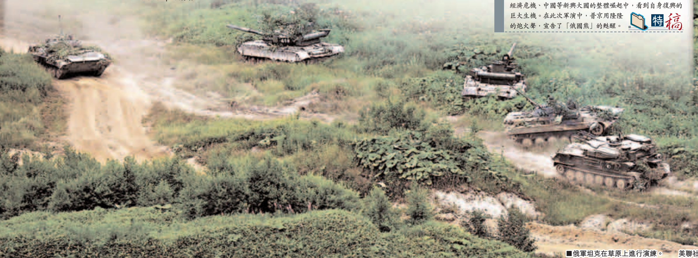
俄軍坦克在草原上進行演練。