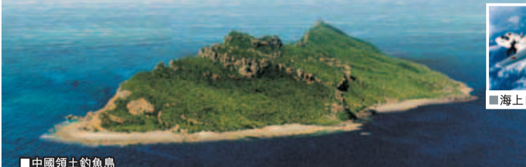
■海上自衛隊E-2C預警機

另據報道，經日本海上保安廳第11管區那霸海上保安本部確認，當地時間17日下午4時許，2艘中國海監船出現在黃尾嶼西北部「毗鄰水域」並持續航行。日方不斷向中方船隻發出「警告」，要求離開該海域，但中方船隻仍繼續巡航。但截至北京時間下午4時許，中方海監船仍在該海域繼續航行。