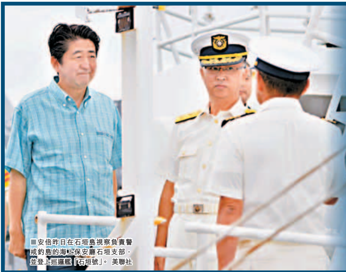
■安倍昨日在石垣島視察負責警戒釣島的海上保安廳石垣支部，並登上巡邏艦「石垣號」。

香港文匯報訊（記者葛沖 北京報道）日本首相安倍晉三17日罕見到訪臨近釣魚島的沖繩縣石垣市，視察承擔所謂「釣魚島警備任務」的海上保安廳石垣海上保安部，並公開演講稱，釣魚島是「日本固有領土」，日方不會退讓。在北京，中國外交部強調，中國政府將繼續採取必要措施，堅決維護釣魚島領土主權，並敦促日方正視歷史和現實，停止一切損害中國領土主權的挑釁言行。17日下午，2艘中國海監船進入釣魚島海域毗鄰水域巡航執法。