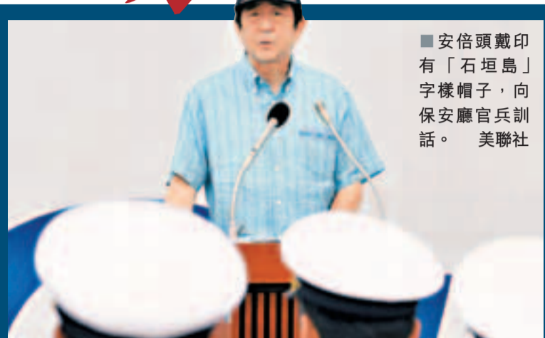
■安倍頭戴印有「石垣島」字樣帽子，向保安廳官兵訓話。

香港文匯報訊（記者葛沖 北京報道）日本首相安倍晉三17日罕見到訪臨近釣魚島的沖繩縣石垣市，視察承擔所謂「釣魚島警備任務」的海上保安廳石垣海上保安部，並公開演講稱，釣魚島是「日本固有領土」，日方不會退讓。在北京，中國外交部強調，中國政府將繼續採取必要措施，堅決維護釣魚島領土主權，並敦促日方正視歷史和現實，停止一切損害中國領土主權的挑釁言行。17日下午，2艘中國海監船進入釣魚島海域毗鄰水域巡航執法。