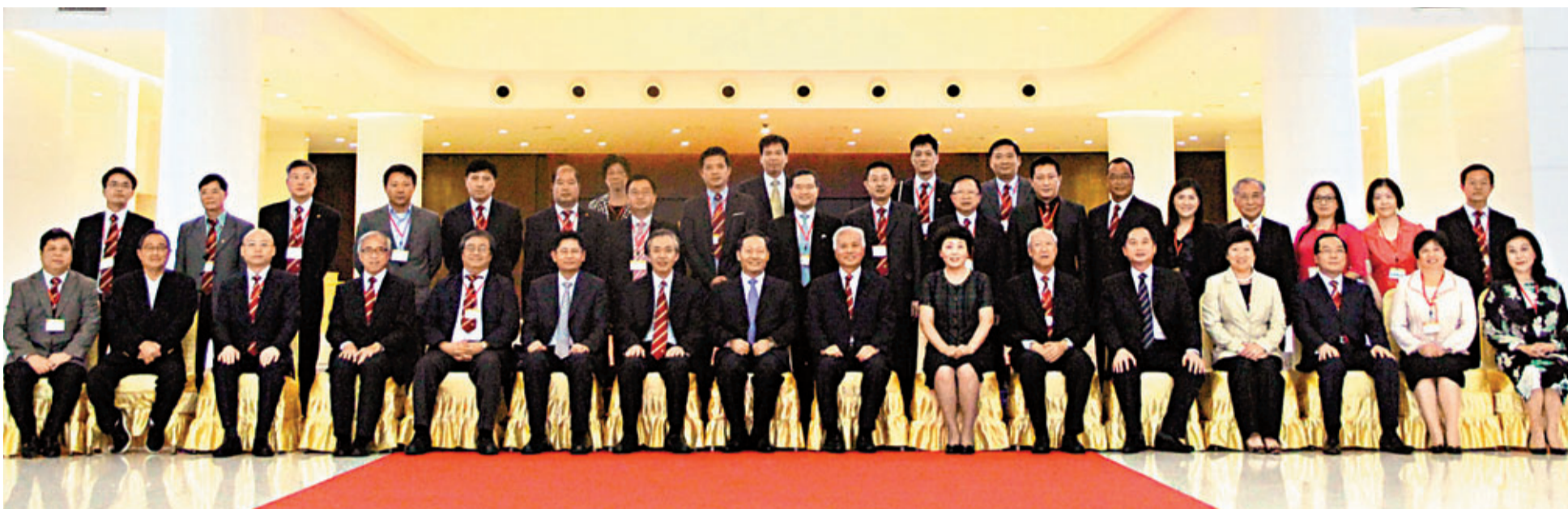
■彭清華與香港中華總商會廣西訪問團合照。

香港文匯報訊（記者 鄭海龍、曾萍，實習記者 姚石歡、羅芳 南寧報道）7月16日，廣西經濟社會發展暨重點項目情況介紹會在南寧荔園山莊舉行，廣西自治區黨委書記彭清華會見了香港中華總商會訪問團。會上，彭清華表示廣西將在未來2年至3年建成現代化立體交通體系，並於2016年開通南寧直達香港高鐵，以進一步拉近桂港距離，促進桂港合作。而為推動香港加入中國—東盟自由貿易區，香港中華總商會也成為首家與廣西東盟博覽局秘書處簽訂合作協議的香港商會。