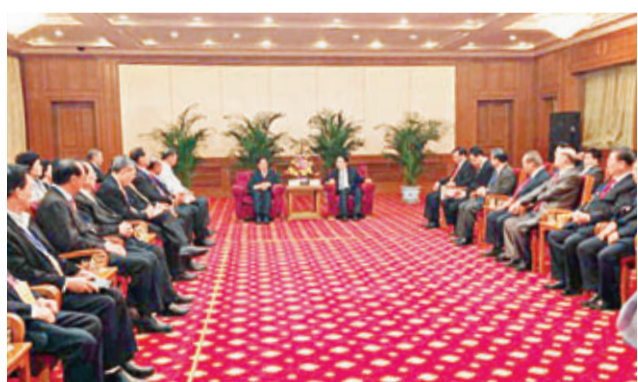
■國僑辦譚天星副主任在釣魚臺國賓館接見訪京團。

應國僑辦邀請，世界李氏宗親總會理事長李常盛率領與監事長李清利及前任理事長李瑞河、李逢梧、李滄洲和中國、香港、台灣、澳門、美國、泰國、菲律賓、馬來西亞、新加坡、印尼、柬埔寨、韓國、法國共13個國家和地區的李氏宗親總會會長總主席等卅餘人於7月4日至9日訪問北京、河北省，受到了十分隆重的接待。國僑辦副主任譚天星、中國僑聯主席林軍、國台辦副主任孫亞夫、河北省常務副省長楊崇勇、副省長楊博勇、石家莊市長王亮、邢台市長孟祥偉、隆堯書記丁辛戈、縣長李建強及各省、市、縣人大、發改委、僑辦、外辦、友好協會、李氏宗親組織等分別給予設宴、接見、座談等，國僑辦盧海田副司長專程全程陪同。