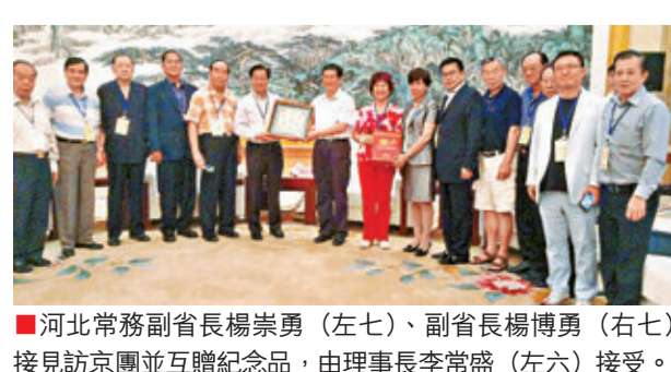
■河北常務副省長楊崇勇（左七）、副省長楊博勇（右七）接見訪京團並互贈紀念品，由理事長李常盛（左六）接受。