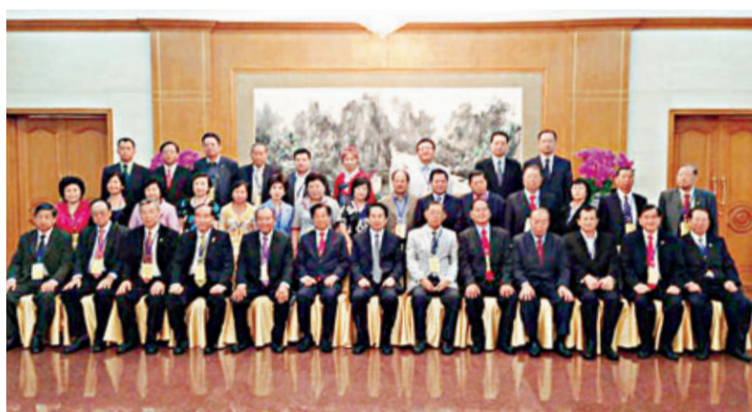
■國僑辦在釣魚臺國賓館接見訪京團。