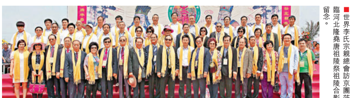
■世界李氏宗親總會訪京團蒞臨河北隆堯唐祖陵祭祖陵合影。