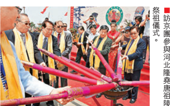
■訪京團參與河北隆堯唐祖陵祭祖儀式。