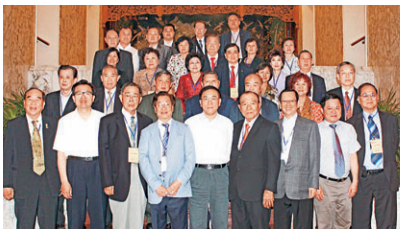
■中國僑聯林軍主席（前排中）接見訪京團。

應國僑辦邀請，世界李氏宗親總會理事長李常盛率領與監事長李清利及前任理事長李瑞河、李逢梧、李滄洲和中國、香港、台灣、澳門、美國、泰國、菲律賓、馬來西亞、新加坡、印尼、柬埔寨、韓國、法國共13個國家和地區的李氏宗親總會會長總主席等卅餘人於7月4日至9日訪問北京、河北省，受到了十分隆重的接待。國僑辦副主任譚天星、中國僑聯主席林軍、國台辦副主任孫亞夫、河北省常務副省長楊崇勇、副省長楊博勇、石家莊市長王亮、邢台市長孟祥偉、隆堯書記丁辛戈、縣長李建強及各省、市、縣人大、發改委、僑辦、外辦、友好協會、李氏宗親組織等分別給予設宴、接見、座談等，國僑辦盧海田副司長專程全程陪同。