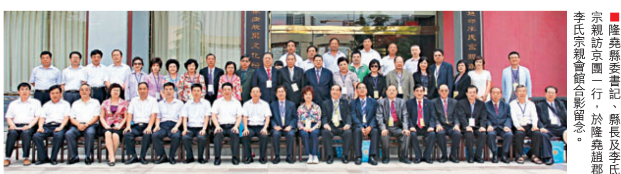
■隆堯縣委書記、縣長及李氏宗親訪京團一行，於隆堯趙郡李氏宗親會館合影留念。